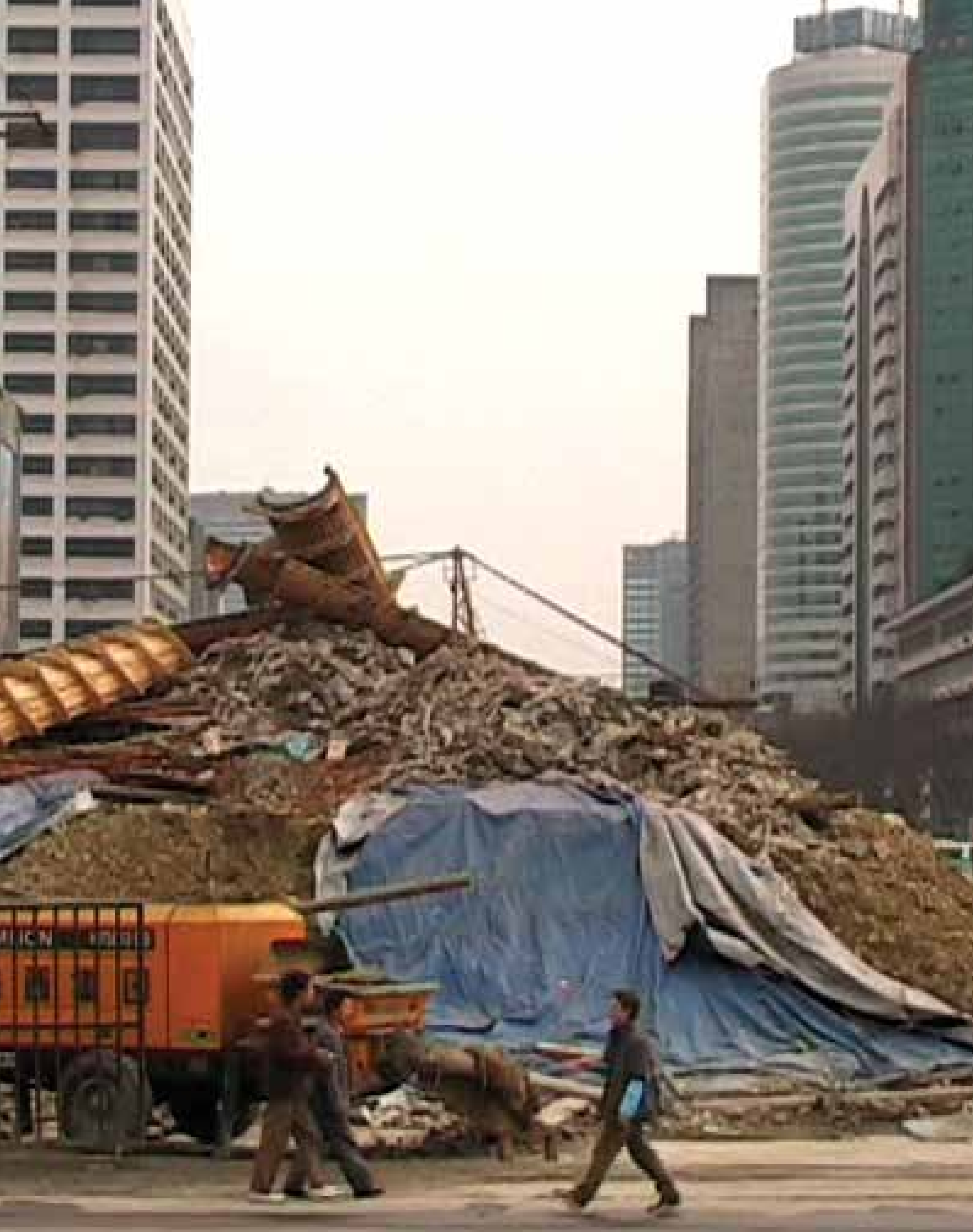
Ping Pong Master Player, 2006-2007 Vidéo, 16'30"