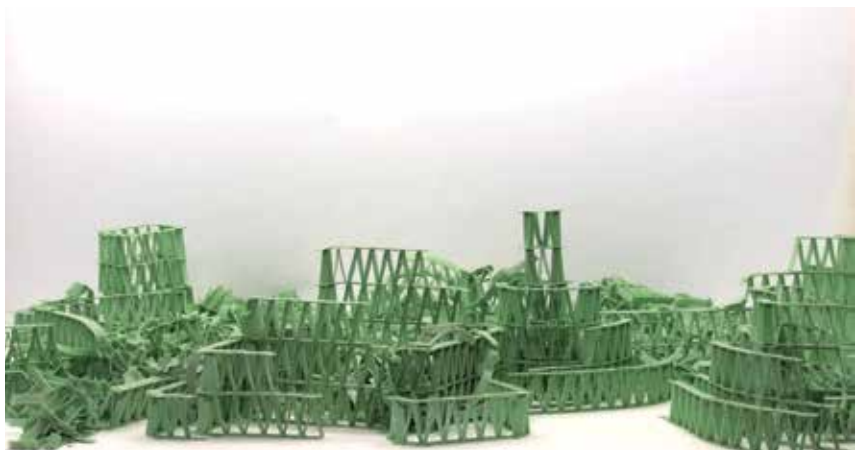
Le Trésor de Mexico, 2012-2013 Vidéo, 16:9, durée : 120 h.