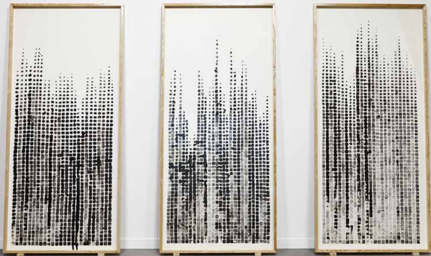
Black Ice Cube Drawings, 2014 Encre de chine sur papier, 3x (120 x 250) cm