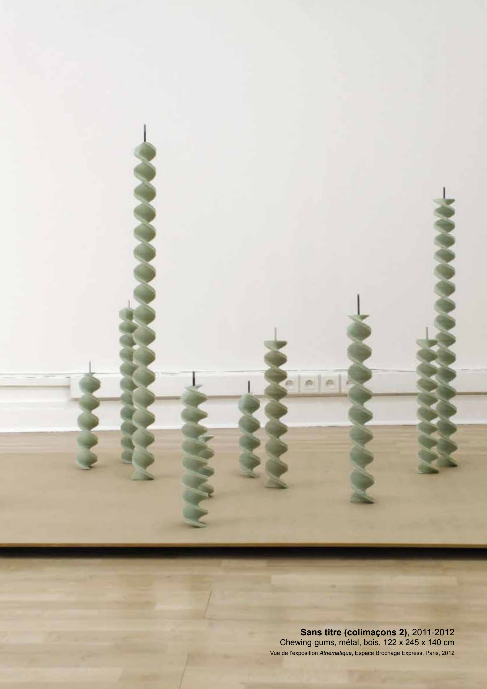
Sans titre (colimaçons 2), 2011-2012 Chewing-gums, métal, bois, 122 x 245 x 140 cm Vue de l'exposition Athématique , Espace Brochage Express, Paris, 2012