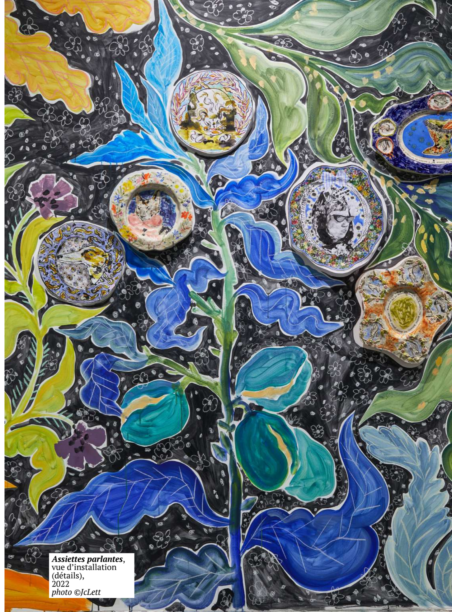
Assiettes parlantes, vue d’installation (détails), 2022