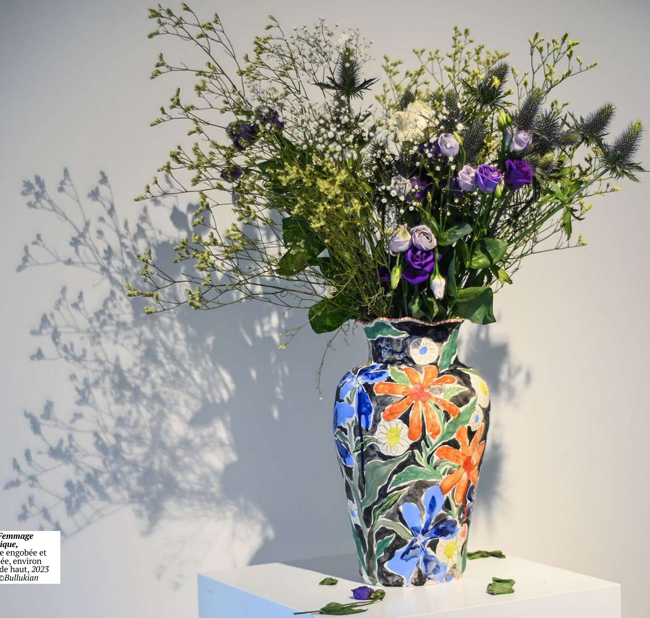
Vase Femmage Botanique, faïence engobée et émaillée, environ 50cm de haut, 2023