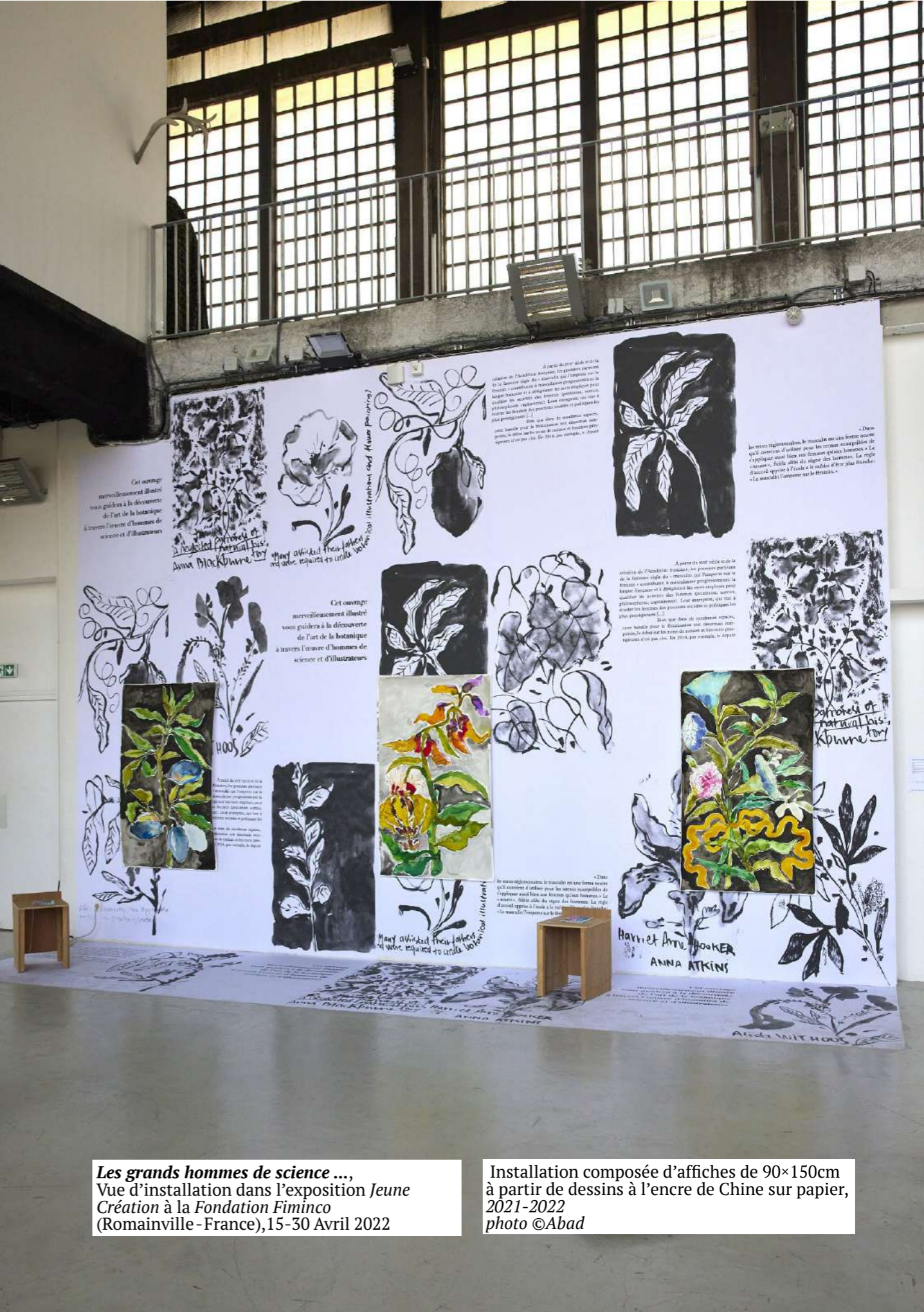
Les grands hommes de science ... , Vue d'installation dans l'exposition Jeune Création à la Fondation Fiminco (Romainville - France), 15-30 Avril 2022

Cet ouvrage merveilleusement illustré vous guidera à la découverte de l'art de la botanique à travers l'œuvre d'hommes de science et d'illustrateurs