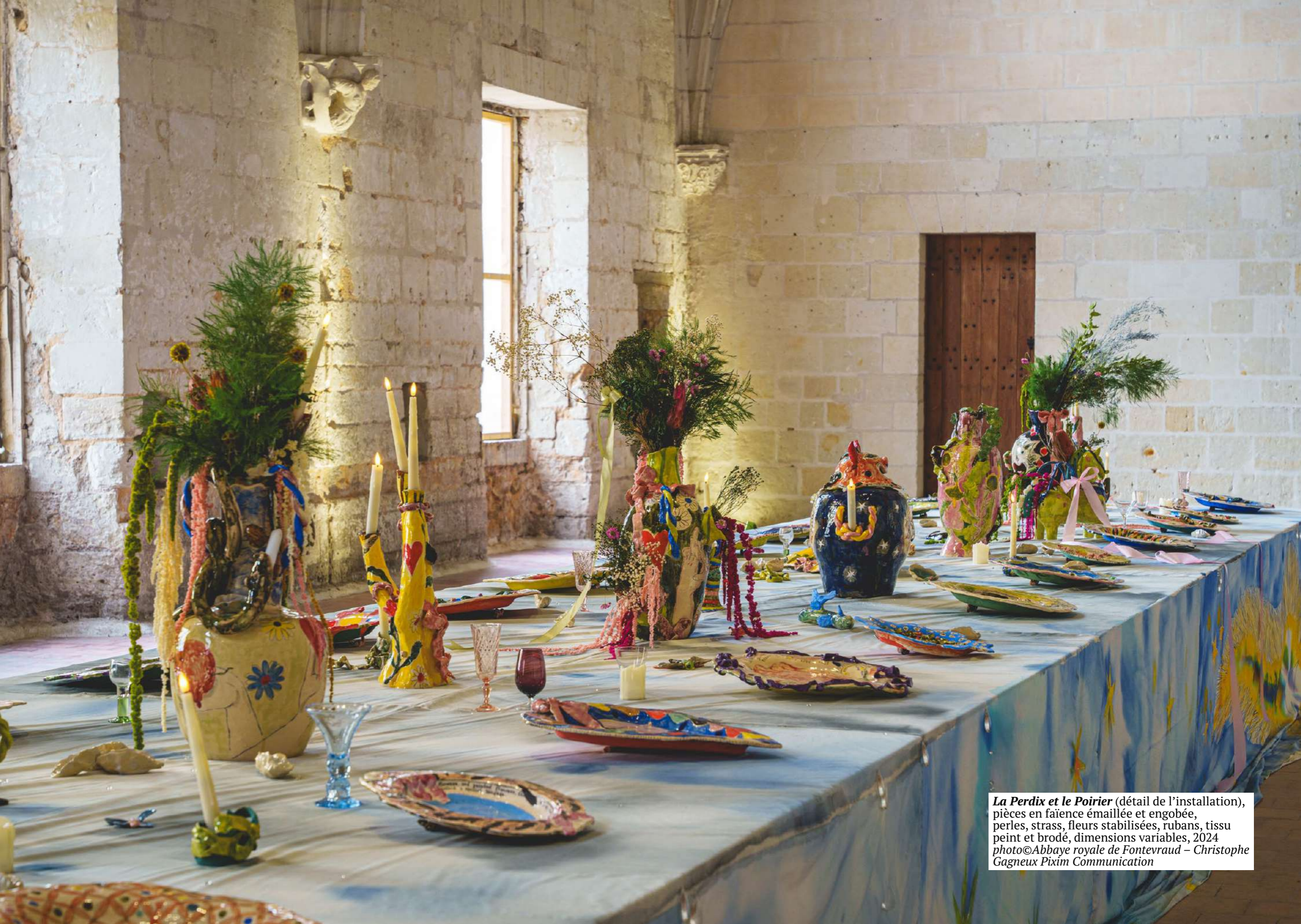
La Perdix et le Poirier (détail de l'installation), pièces en faïence émaillée et engobée, perles, strass, fleurs stabilisées, rubans, tissu peint et brodé, dimensions variables, 2024