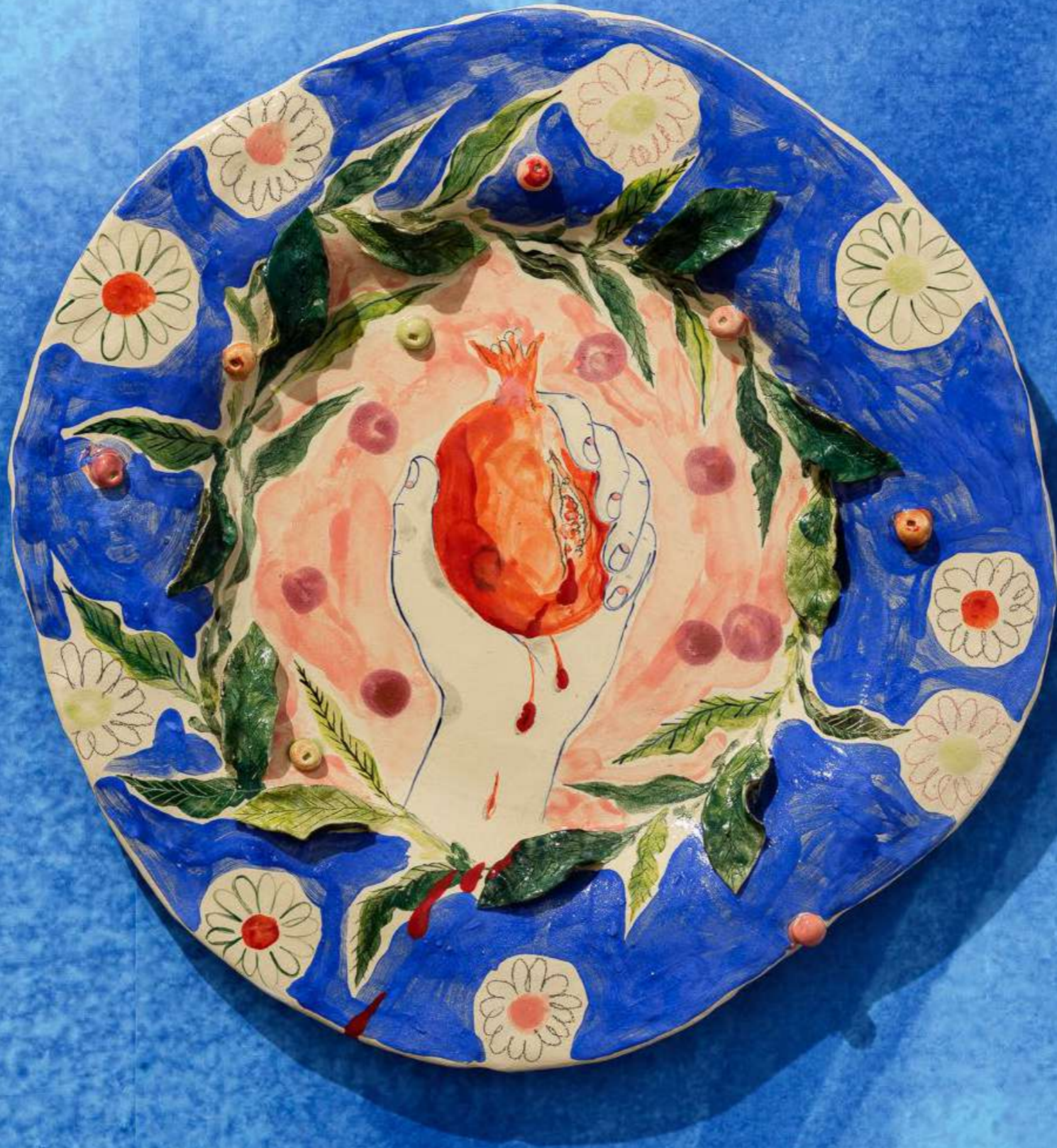
La Grenade, faïence engobée et émaillée, environ 50cm de diamètre, 2024