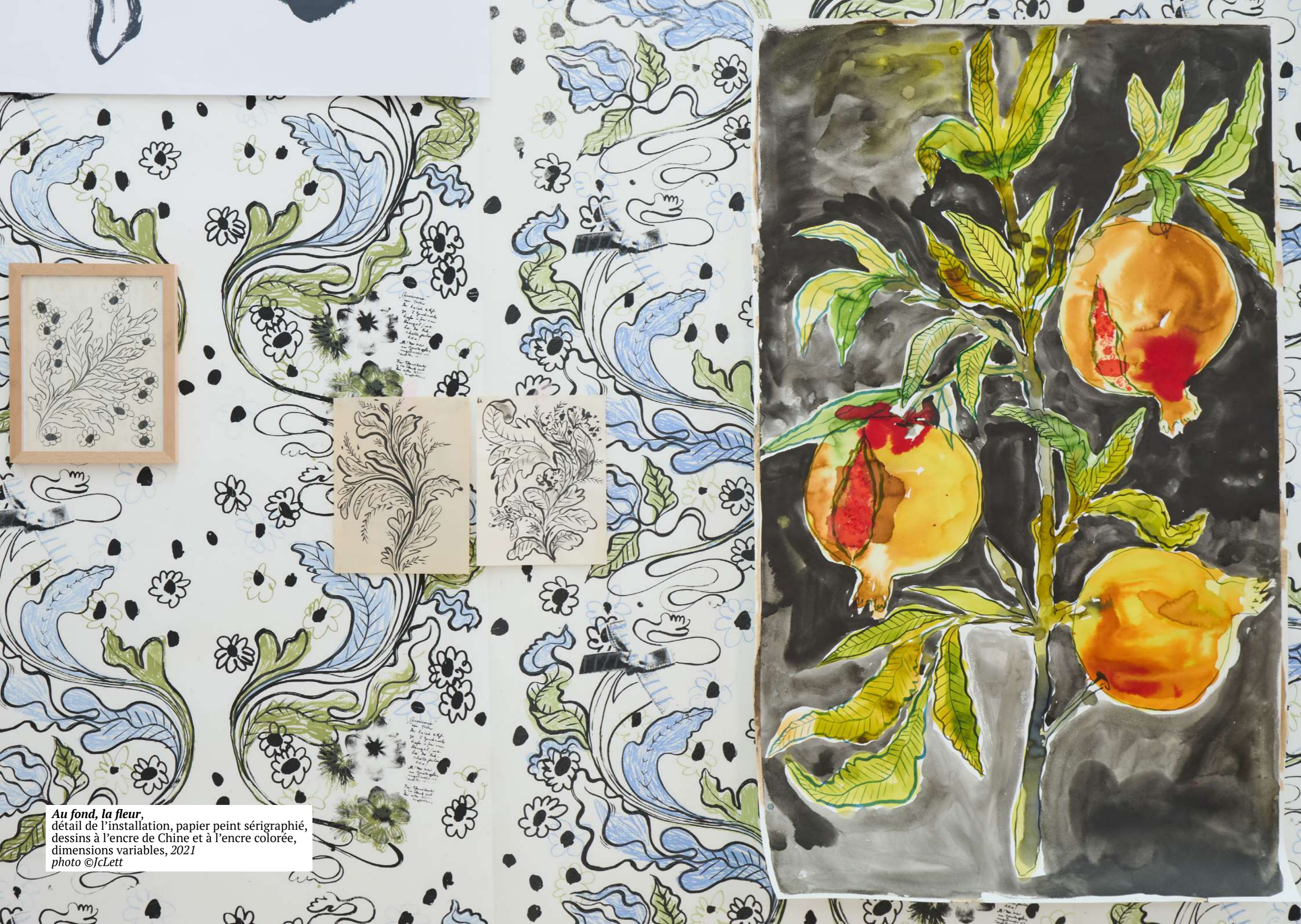
Au fond, la fleur, détail de l'installation, papier peint sérigraphié, dessins à l'encre de Chine et à l'encre colorée, dimensions variables, 2021