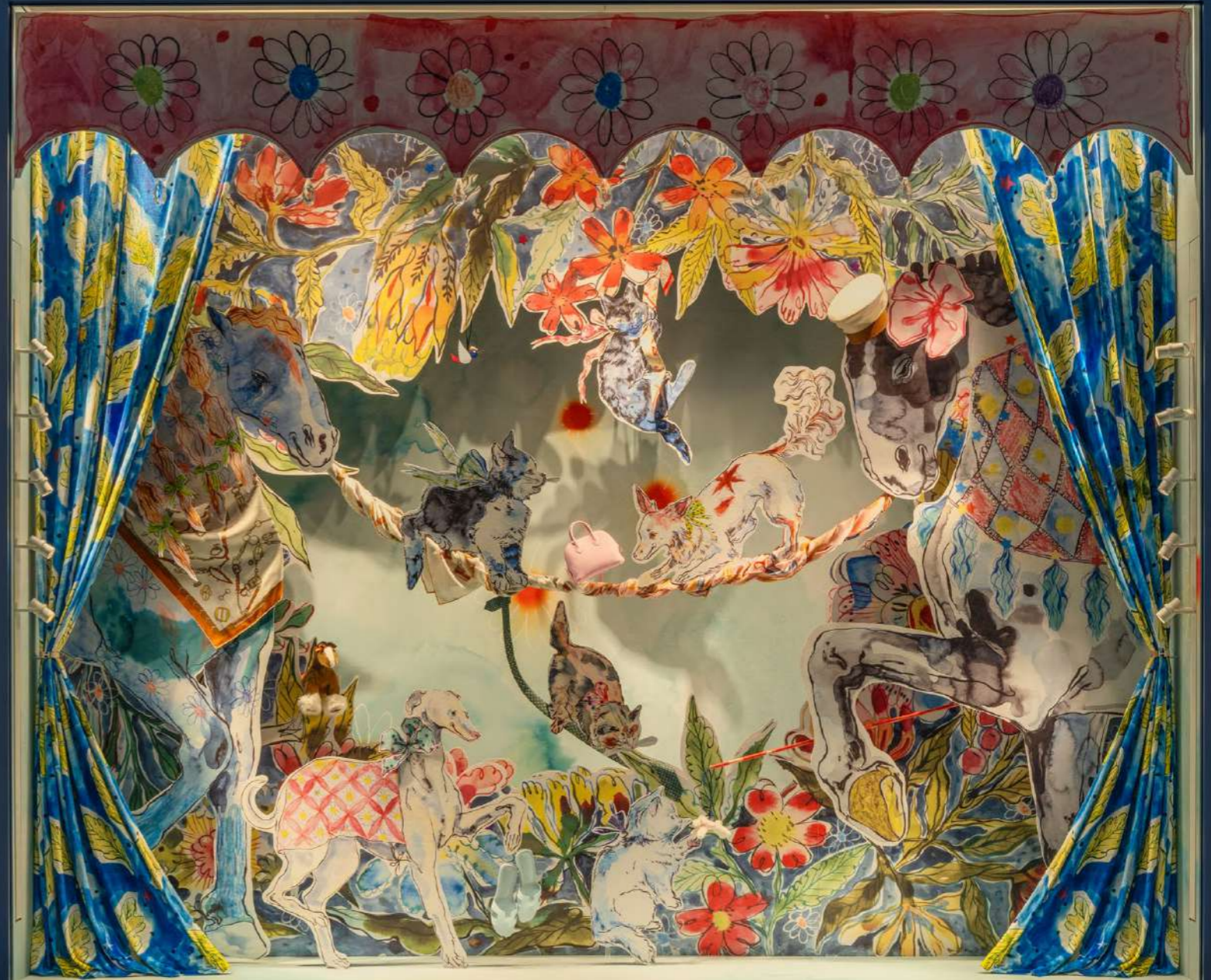
Le Petit Théâtre , vitrine Hermès à l'aéroport de Shenzhen Bao'an (Chine), dessins imprimés numériquement, tissu, pampilles, 2025