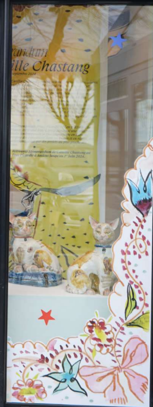
Memorandum , vue d'installation du Lieu Noir , vitrine hors les murs du Frac Picardie, dessins sur papier, faïence émaillée, 2024