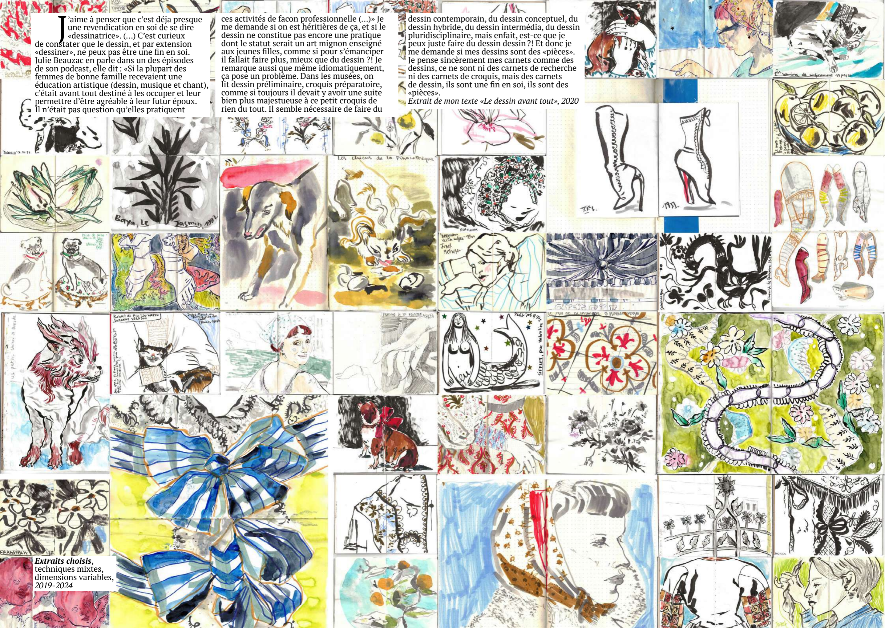
Extraits choisis, techniques mixtes, dimensions variables, 2019-2024

dessin contemporain, du dessin conceptuel, du dessin hybride, du dessin intermédia, du dessin pluridisciplinaire, mais en fait, est-ce que je peux juste faire du dessin dessin ?! Et donc je me demande si mes dessins sont des «pièces». Je pense sincèrement mes carnets comme des dessins, ce ne sont ni des carnets de recherche ni des carnets de croquis, mais des carnets de dessin, ils sont une fin en soi, ils sont des «pièces». Extrait de mon texte «Le dessin avant tout», 2020