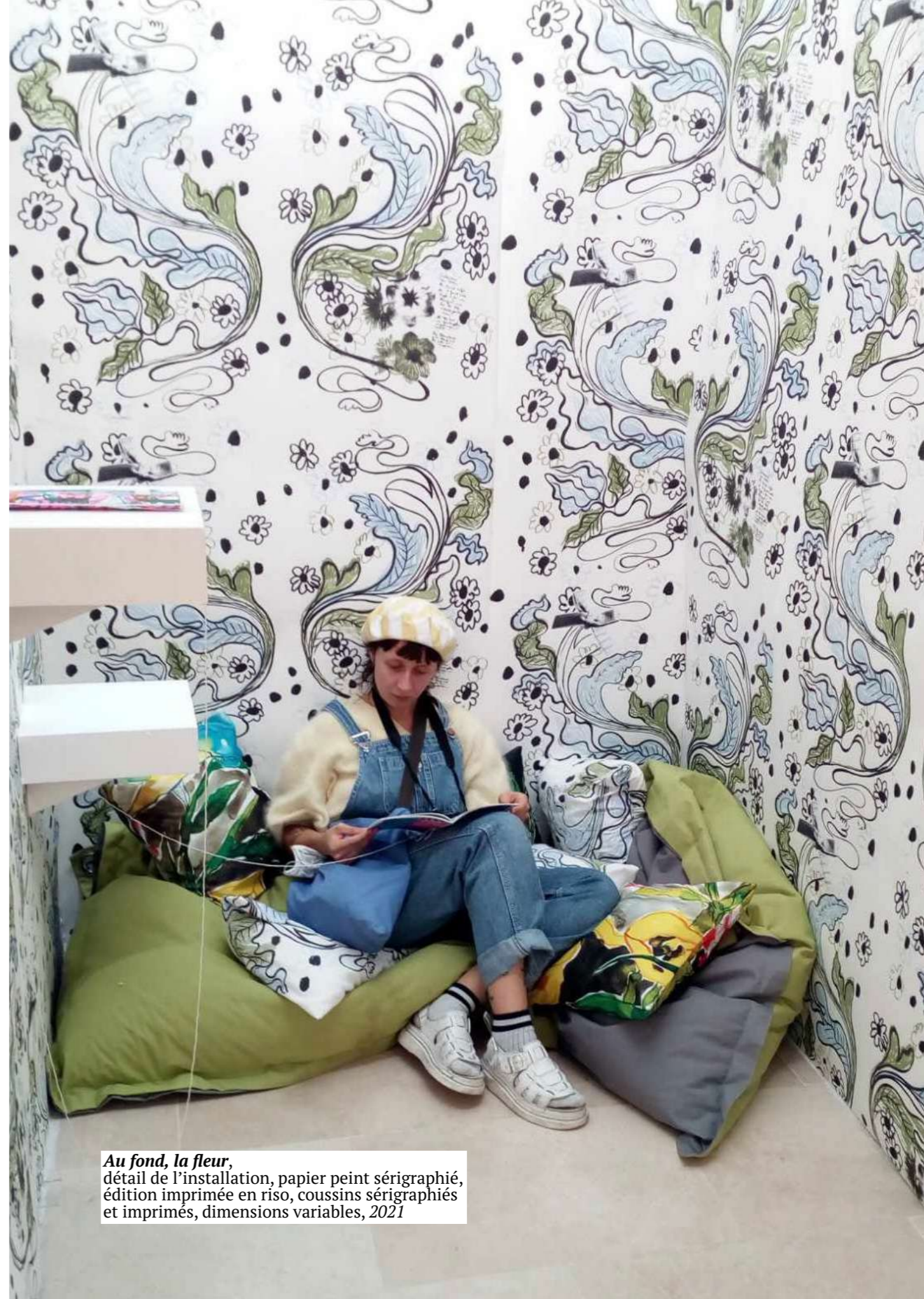
Au fond, la fleur , détail de l'installation, papier peint sérigraphié, édition imprimée en riso, coussins sérigraphiés et imprimés, dimensions variables, 2021

Texte à lire en entier ici Edition à découvrir là