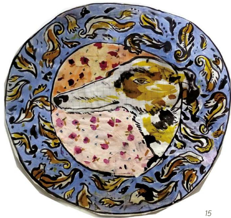
Assiettes, techniques mixtes sur papier, dimensions variables (environ 30cm de diamètre) 2020