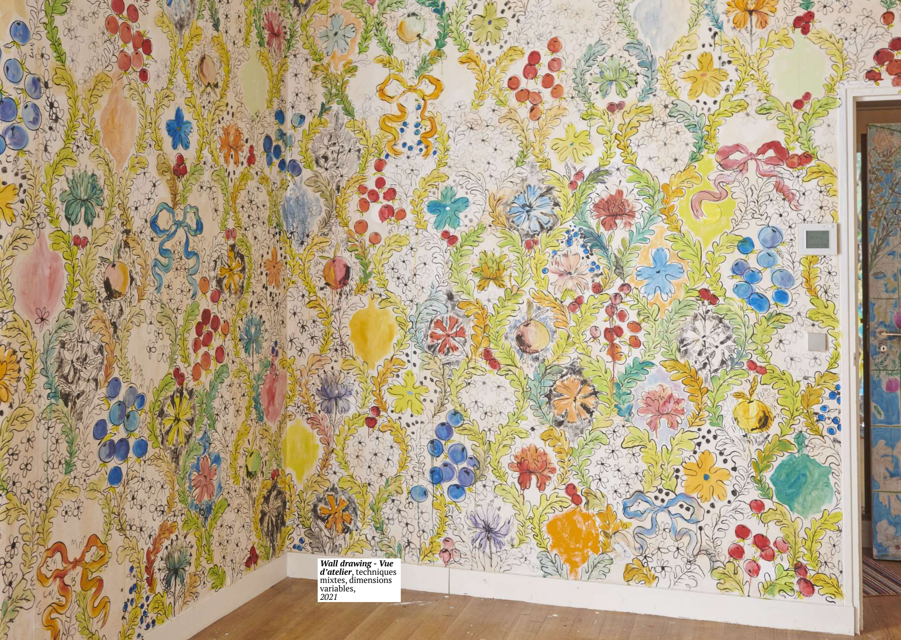
Wall drawing - Vue d'atelier , techniques mixtes, dimensions variables, 2021