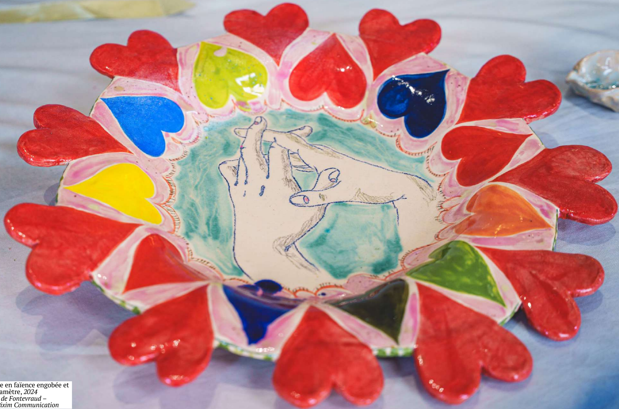
Le Printemps , assiette en faïence engobée et émaillée, 50 cm de diamètre, 2024