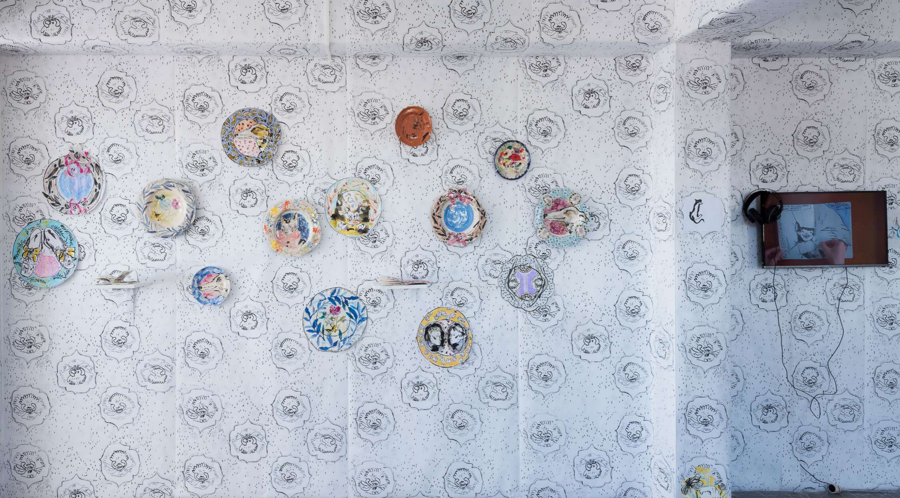
Vue d'installation «Le dessin avant tout» , céramiques, dessin sur carton, dessins, carnets + papier peint sérigraphié, 2020

(...) Ma première année à la Villa Arson, je rentre un soir chez moi, un carton à dessin sous le bras. Je croise une fille de cinquième année, qui ne faisait «que du son», et à qui je n'avais jamais adressé la parole. Elle me lance «Bah alors, tu rentres chez toi avec tes petits dessins ?» Je m'étais sentie super triste et humiliée. Humiliée d'avoir un travail trop matériel pour supporter de n'être stocké que dans un ordinateur, et pas assez grand pour