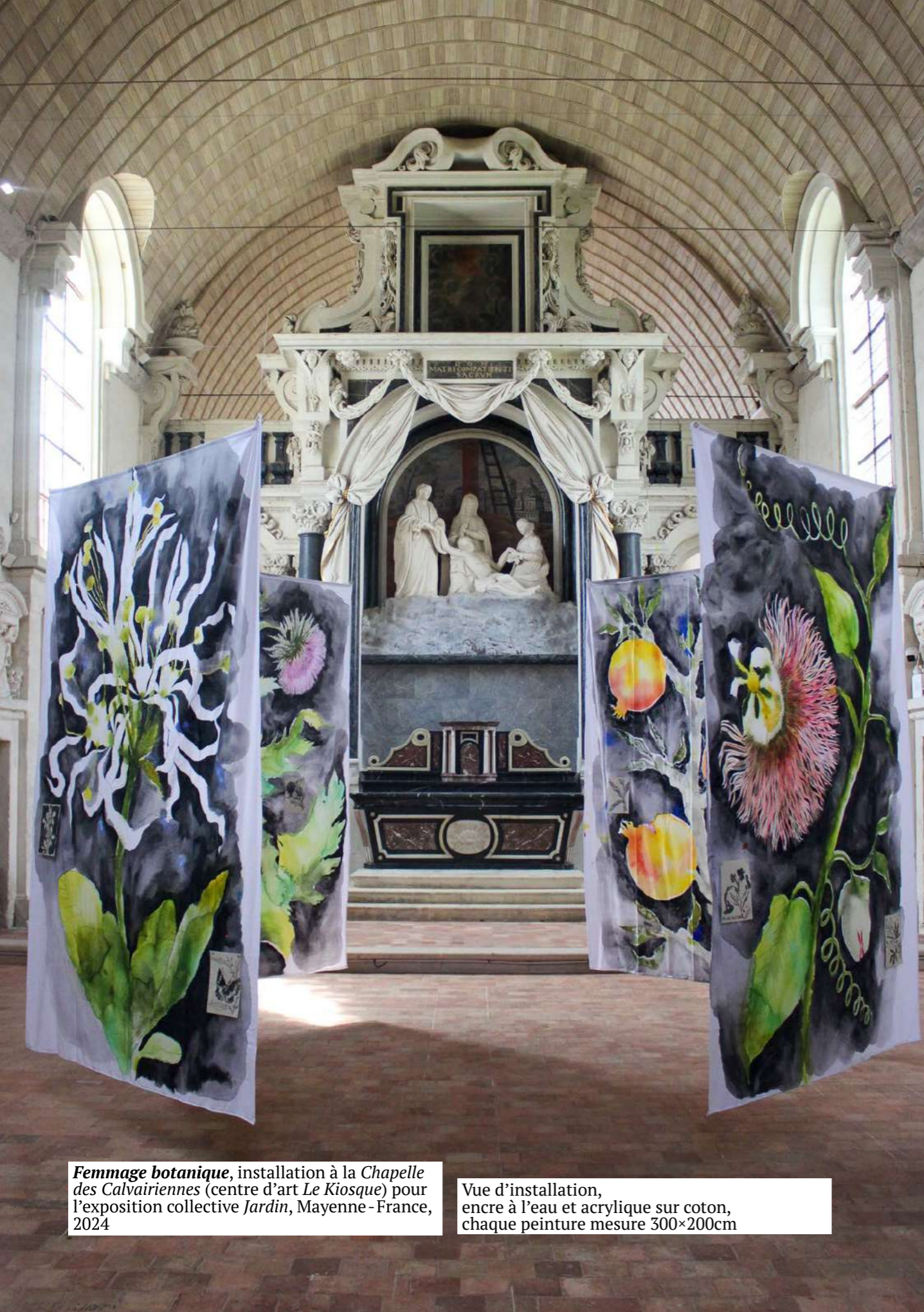
Femmage botanique , installation à la Chapelle des Calvairiennes (centre d'art Le Kiosque) pour l'exposition collective Jardin , Mayenne - France, 2024