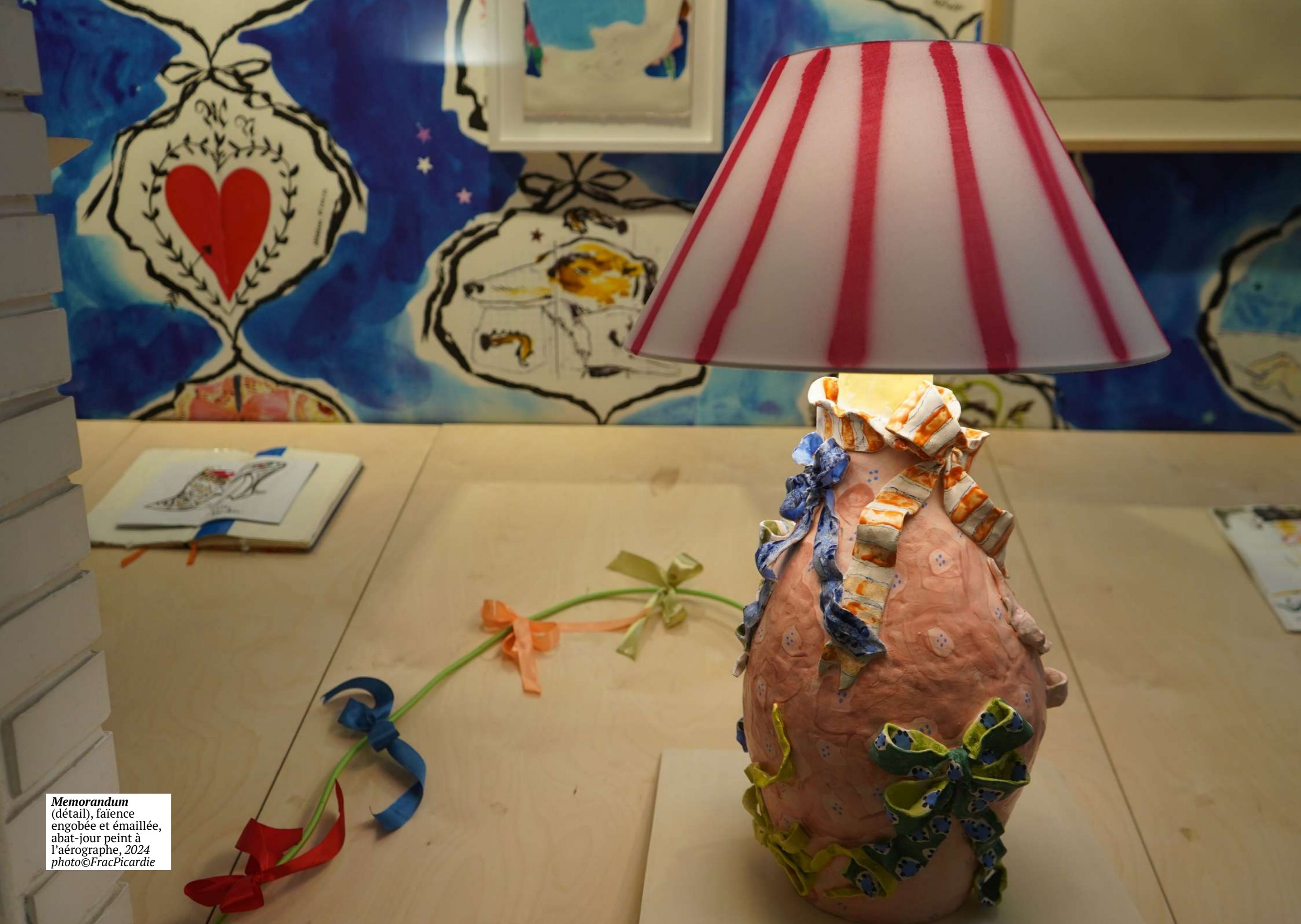
Memorandum (détail), faïence engobée et émaillée, abat-jour peint à l'aérographe, 2024