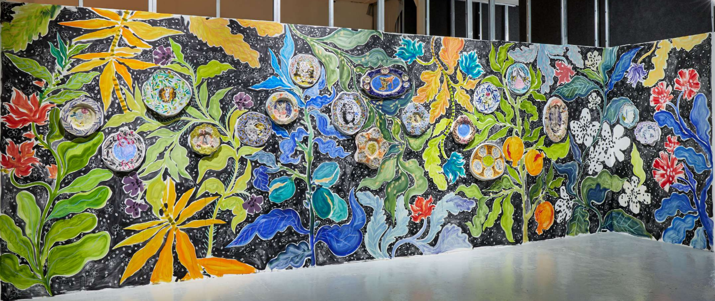
Assiettes parlantes , vue d'installation de l'exposition collective "La relève 4-Veiller" organisée par le festival Parallèle au Château de Servières (Marseille), Janv.-Avril 2022