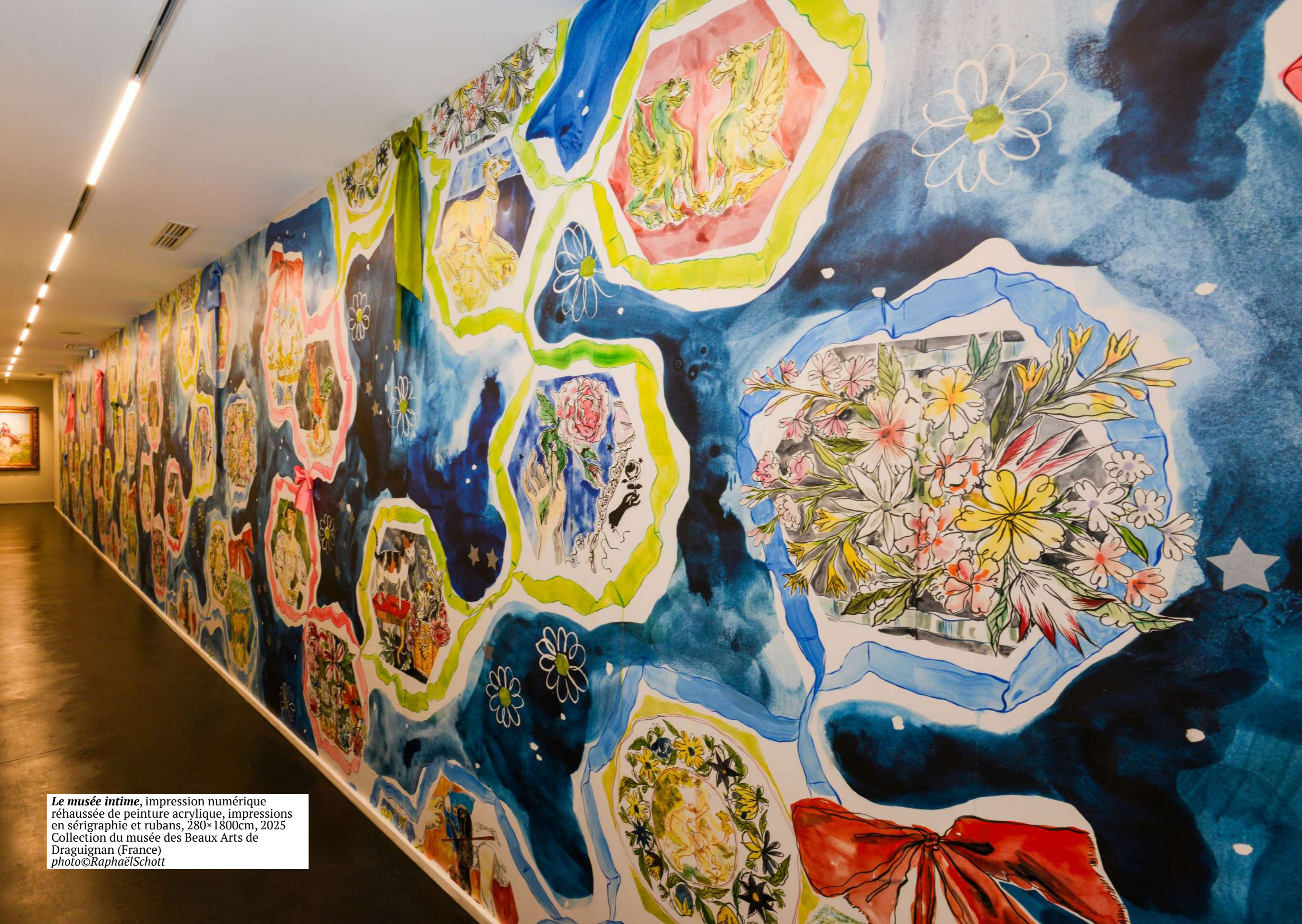
Le musée intime , impression numérique réhaussée de peinture acrylique, impressions en sérigraphie et rubans, 280×1800cm, 2025 Collection du musée des Beaux Arts de Draguignan (France)