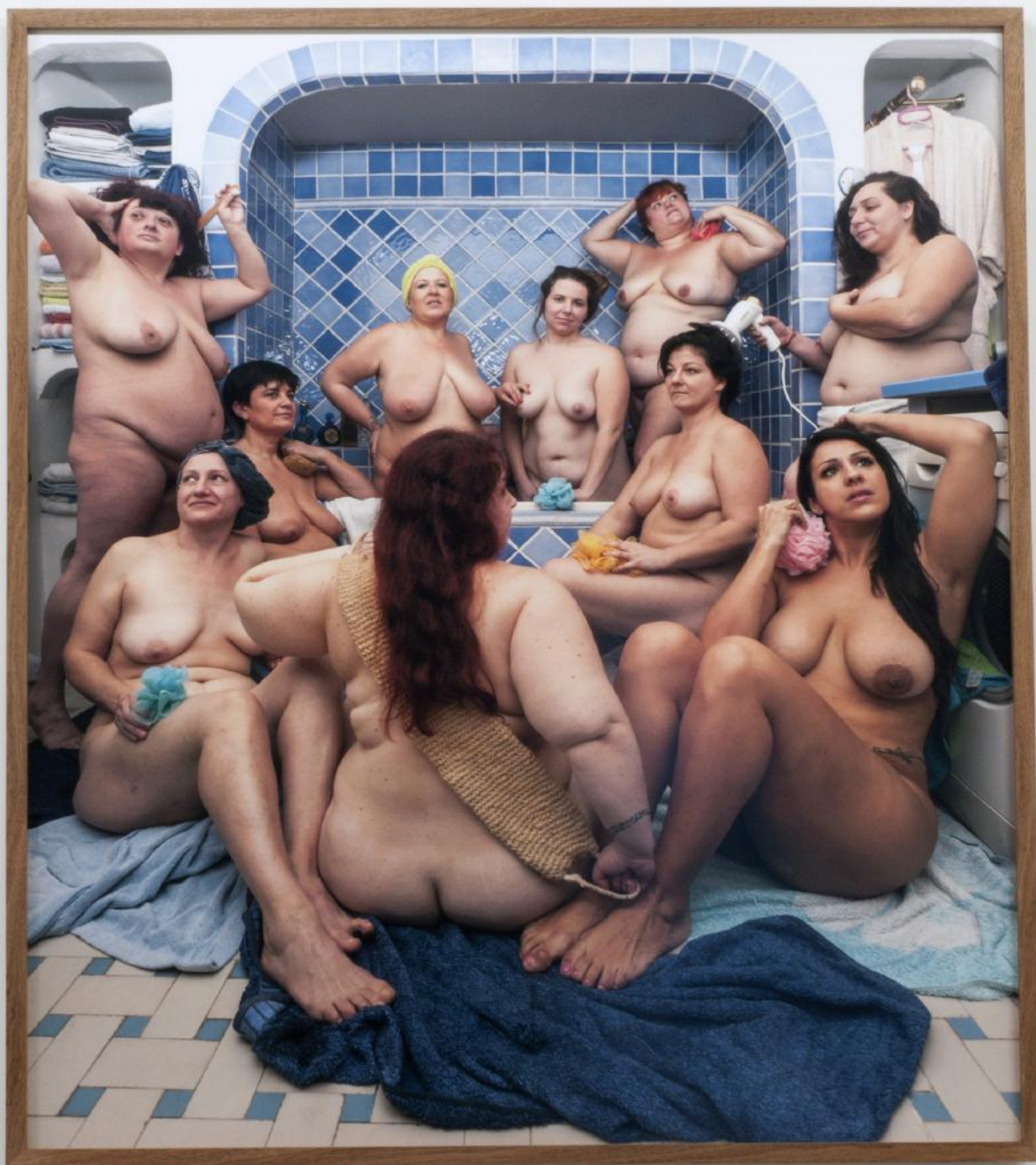
Femmes au bain , photographie numérique contre-collée sur PVC, encadrée, 150 x 177 cm, 2015