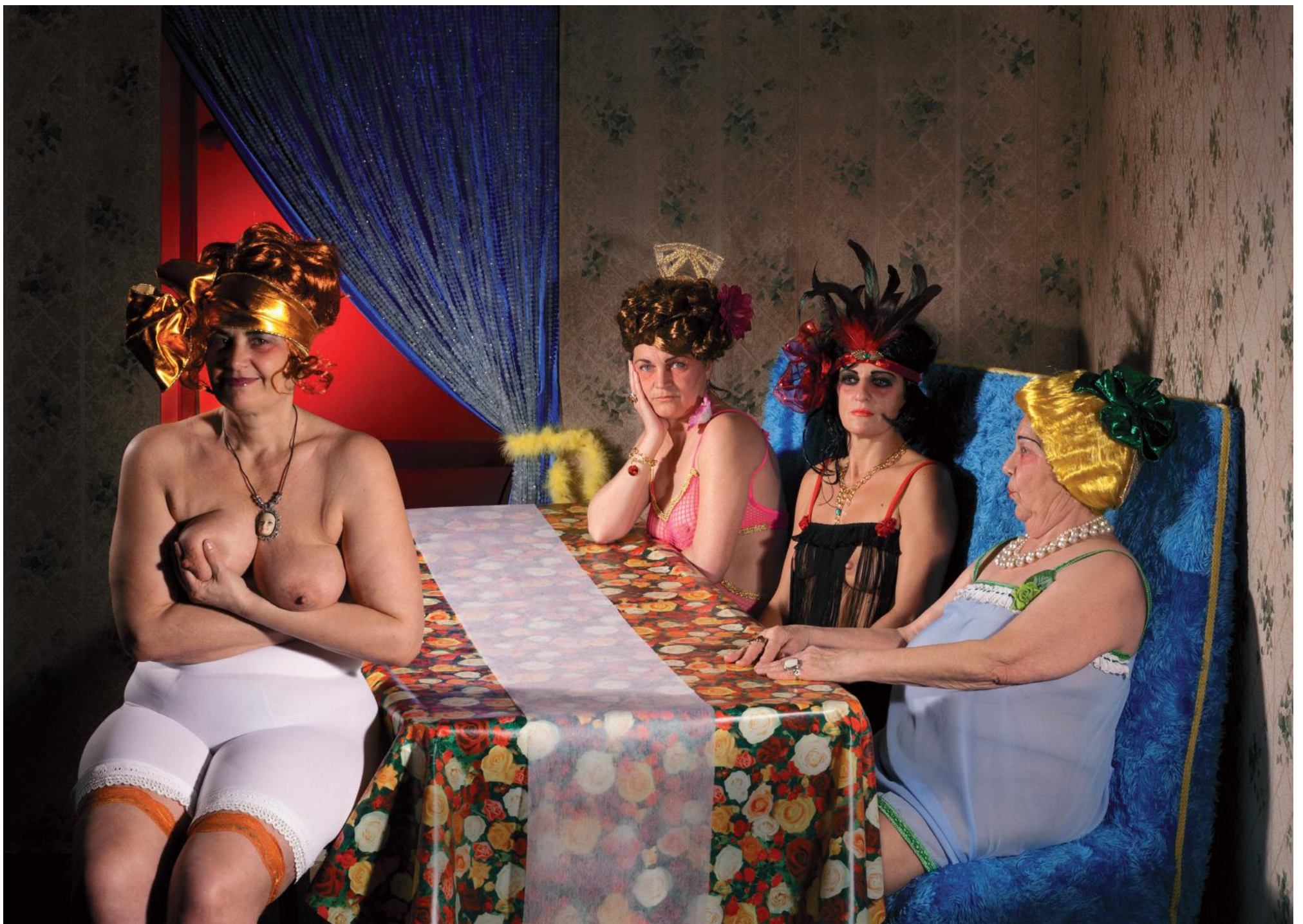
Postiche , photographie numérique contrecollée sur dibond, 86 x 120,5 cm, 2013