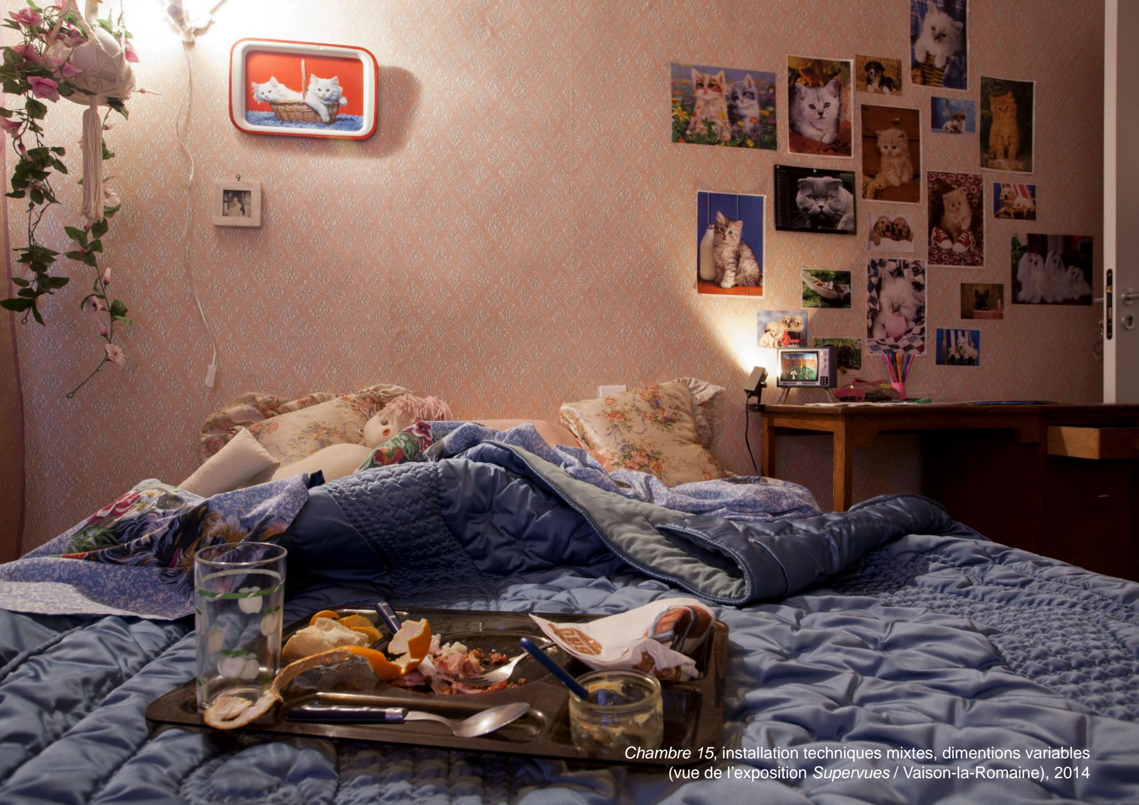
Chambre 15, installation techniques mixtes, dimensions variables (vue de l'exposition Supervues / Vaison-la-Romaine), 2014