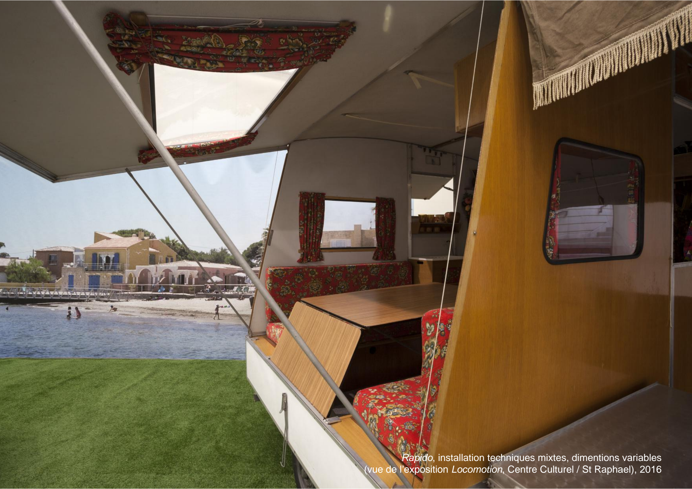
Rapido , installation techniques mixtes, dimensions variables (vue de l'exposition Locomotion , Centre Culturel / St Raphael), 2016