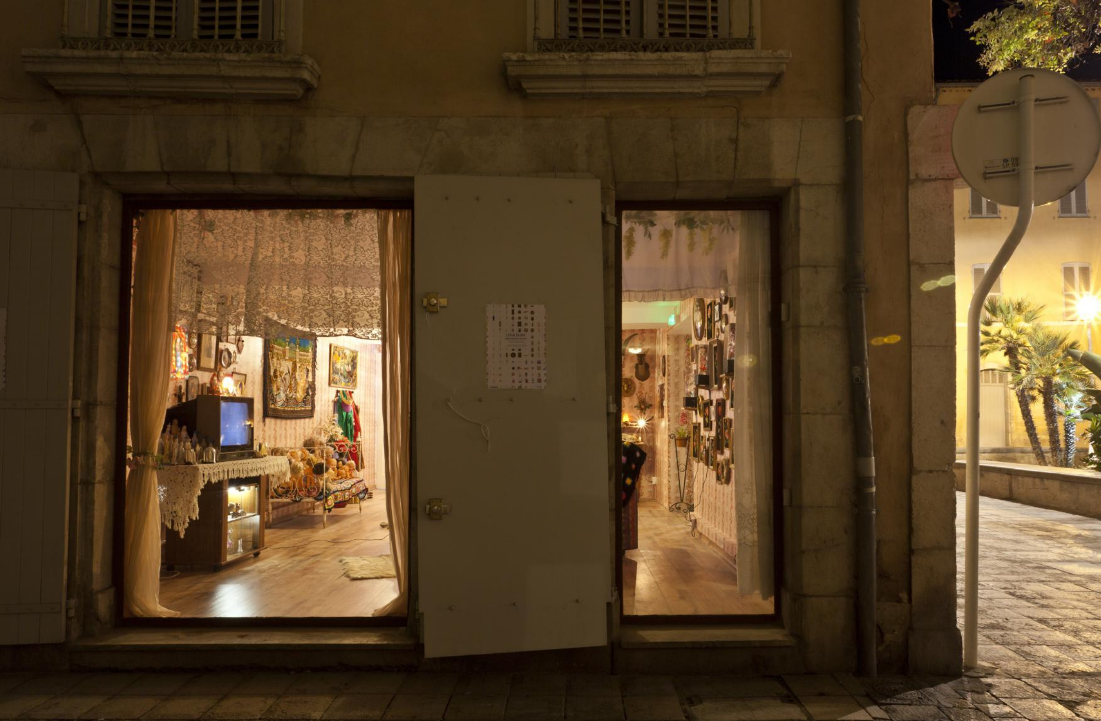
Appartement Témoin , installation techniques mixtes, dimensions variables (vue de l'exposition Appartement Témoin , Galerie du Globe / Toulon), 2013