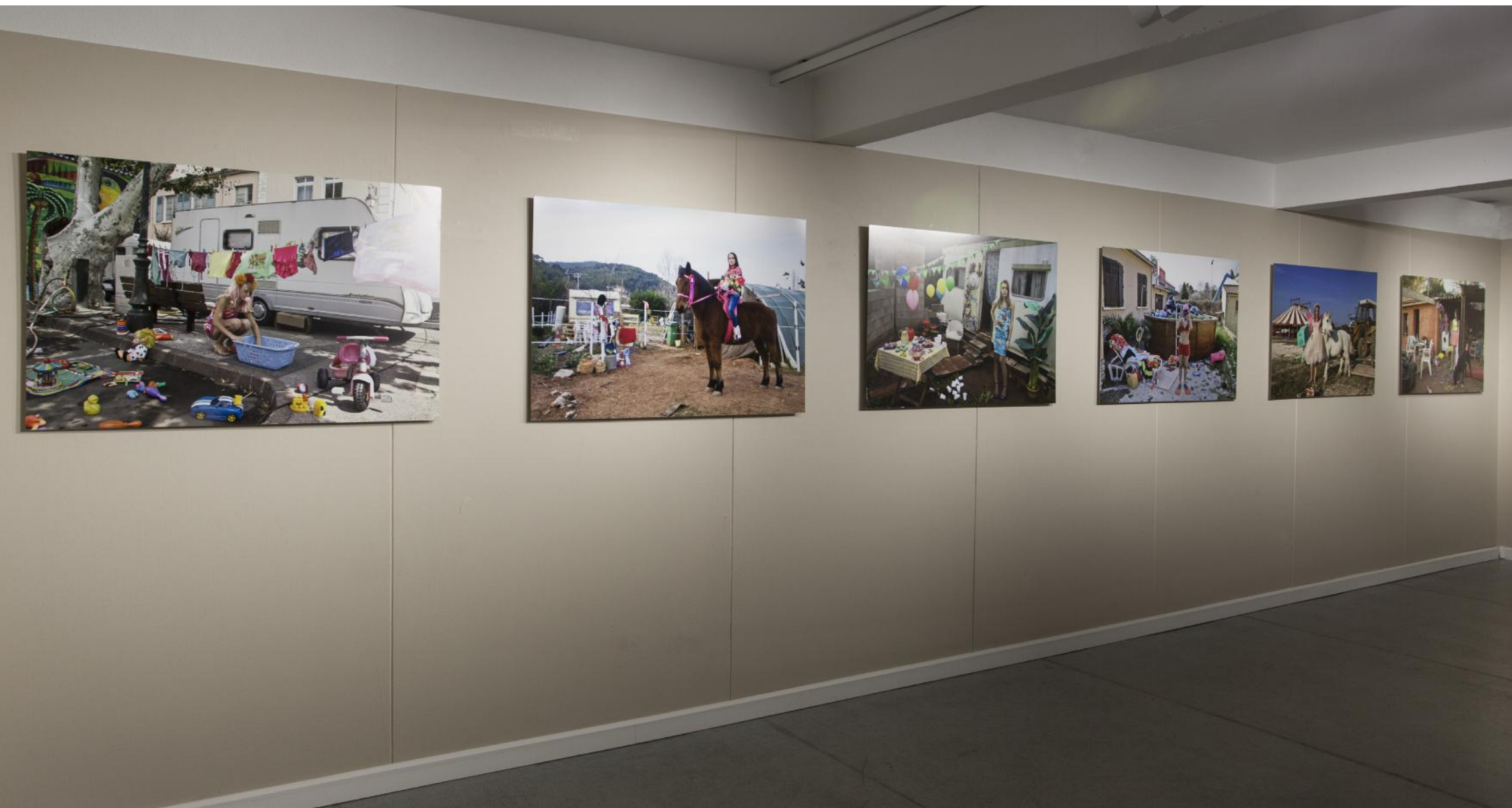
vue de l'exposition Zone de retournement , Maison de la Photographie / Toulon, 2016