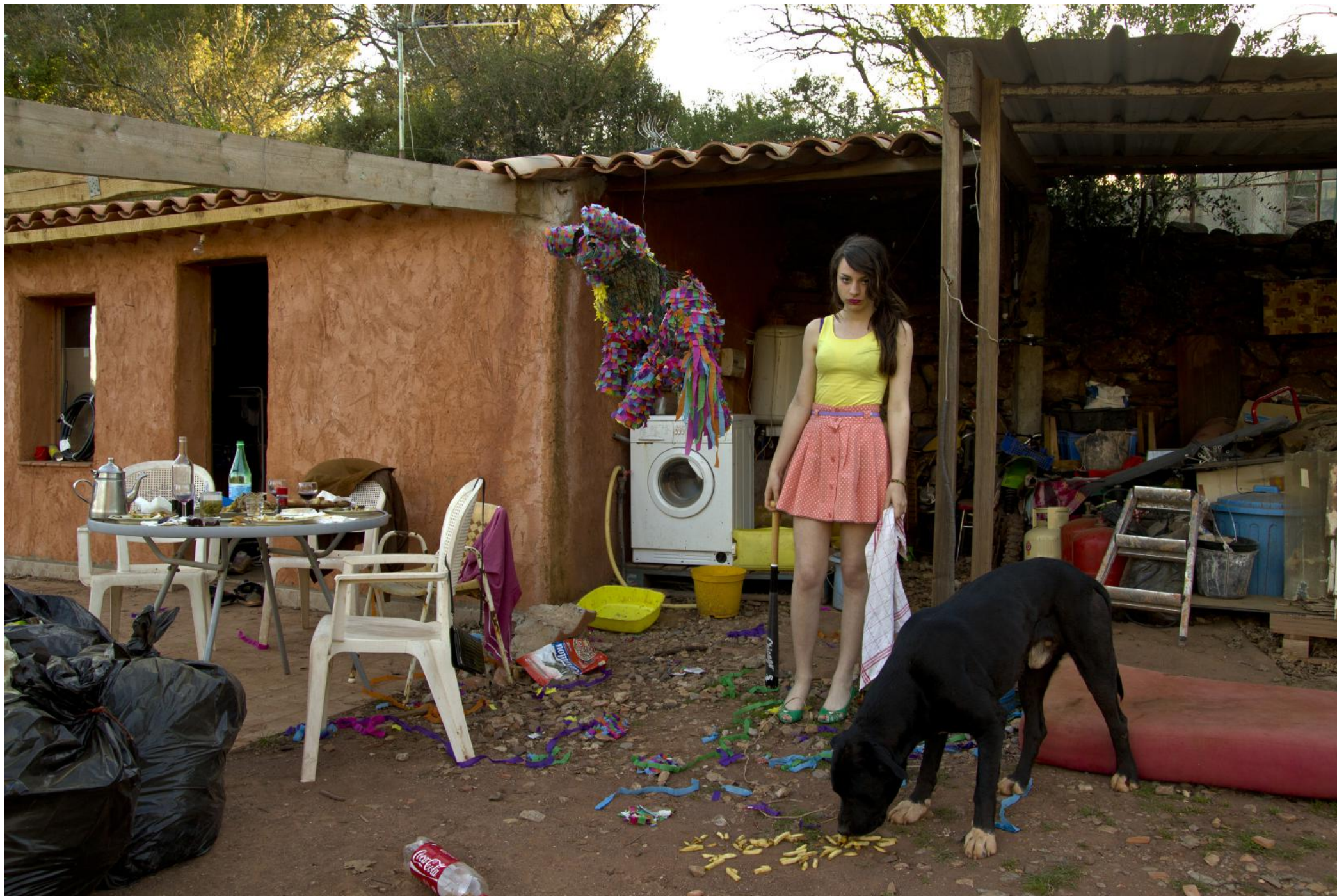
Chloé , tirage numérique contrecollé sur dibon, 78 x 112 cm, 2011