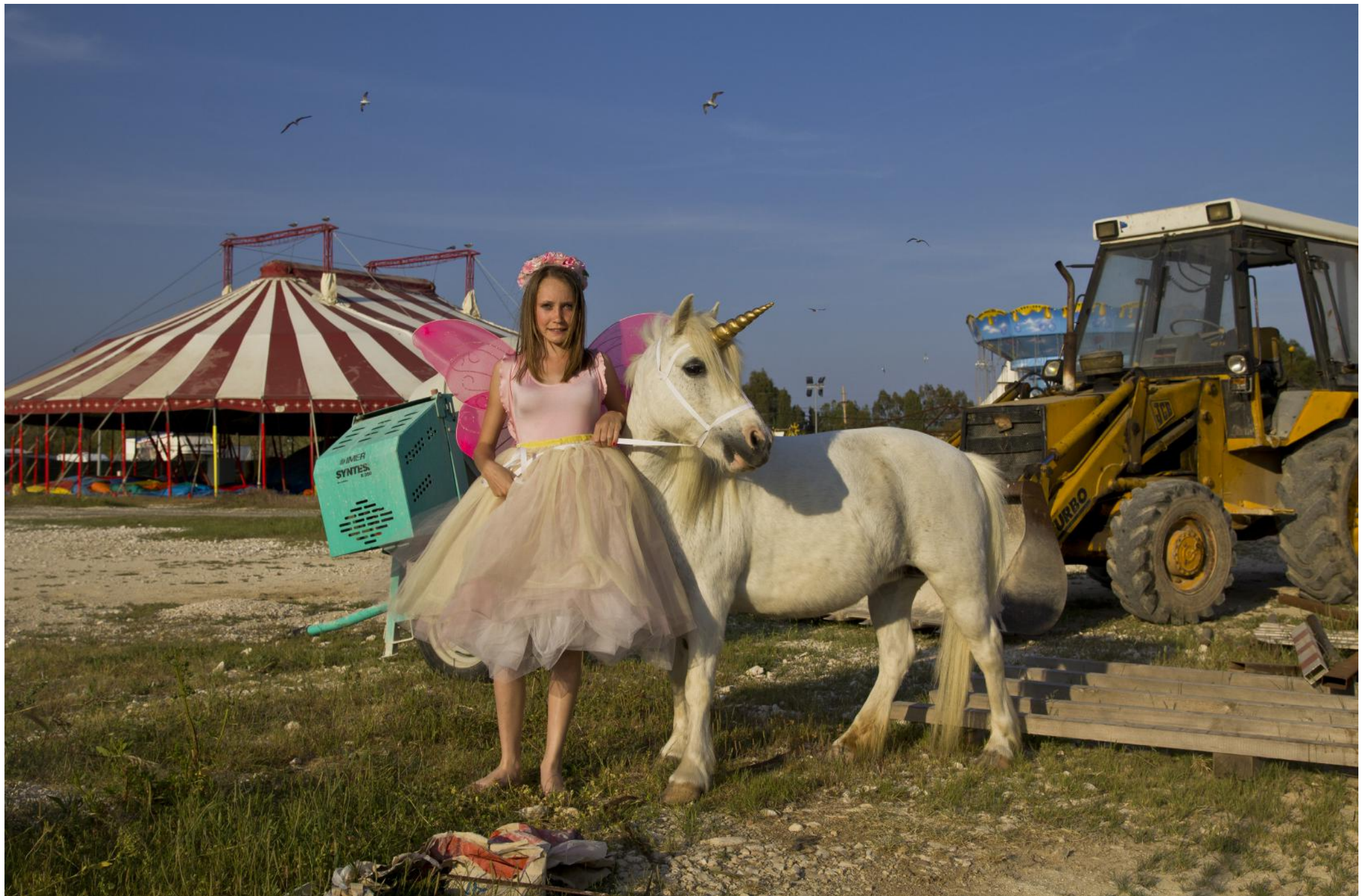
Cindy , tirage numérique contrecollé sur dibon, 78 x 112 cm, 2011