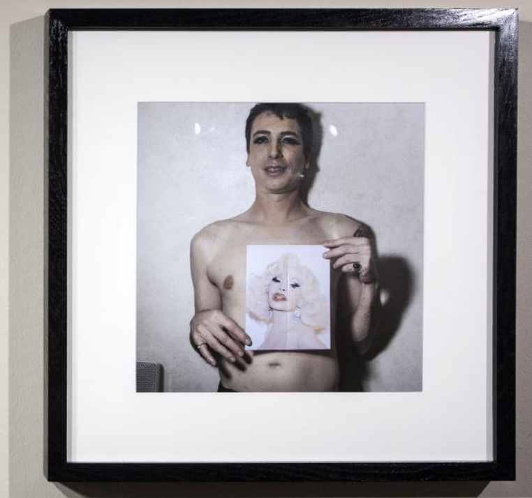
Travesti, Toulon, 2016, tirage numérique encadré, 39 x 39 cm, 2016 Travesti avec un portrait d'Amanda Lepore, Toulon, 2016, tirage numérique encadré, 39 x 39 cm, 2016