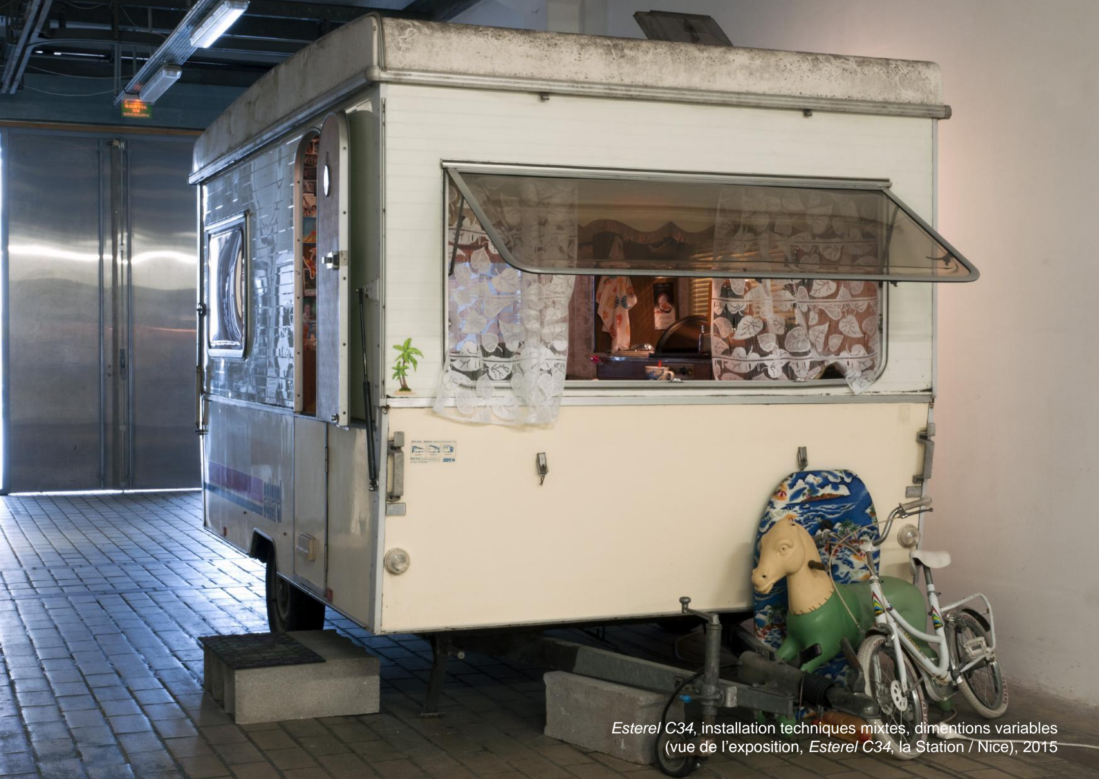
Esterel C34, installation techniques mixtes, dimensions variables (vue de l'exposition, Esterel C34, la Station / Nice), 2015