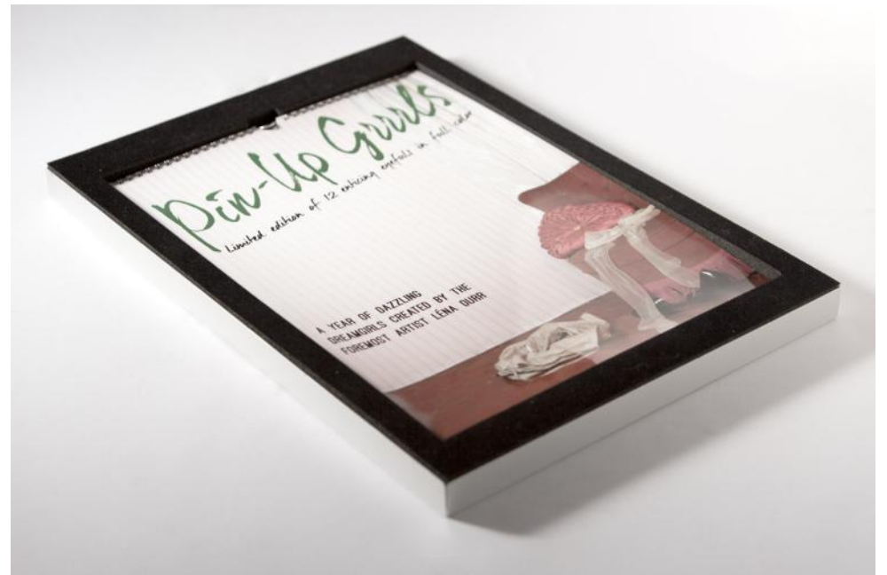
Pin-Up Grrrls , calendrier perpétuel de douze images + couverture, Boîte en aluminium gravé, 34 x 49 x 2,5 cm, 2014