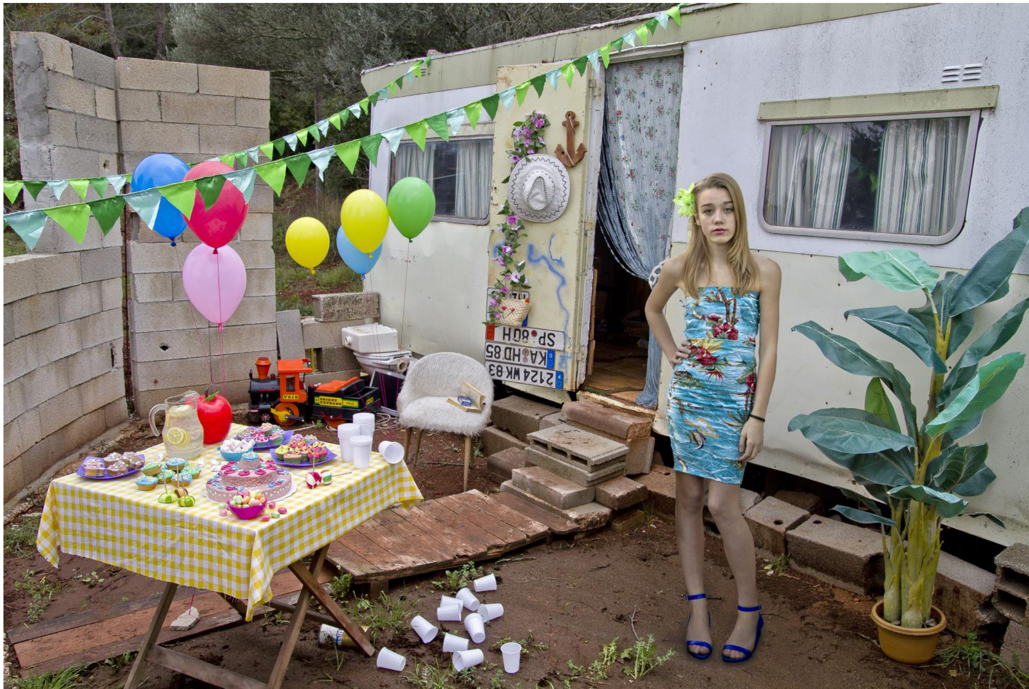
Julie , tirage numérique contrecollé sur dibon, 78 x 112 cm, 2010