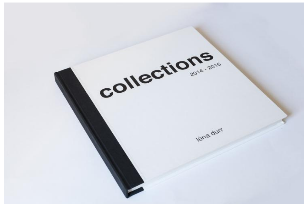
Collection, tome 1, 176 pages, 30 x 30 cm, 2014 Collection, tome 2, 157 pages, 30 x 30 cm, 2016