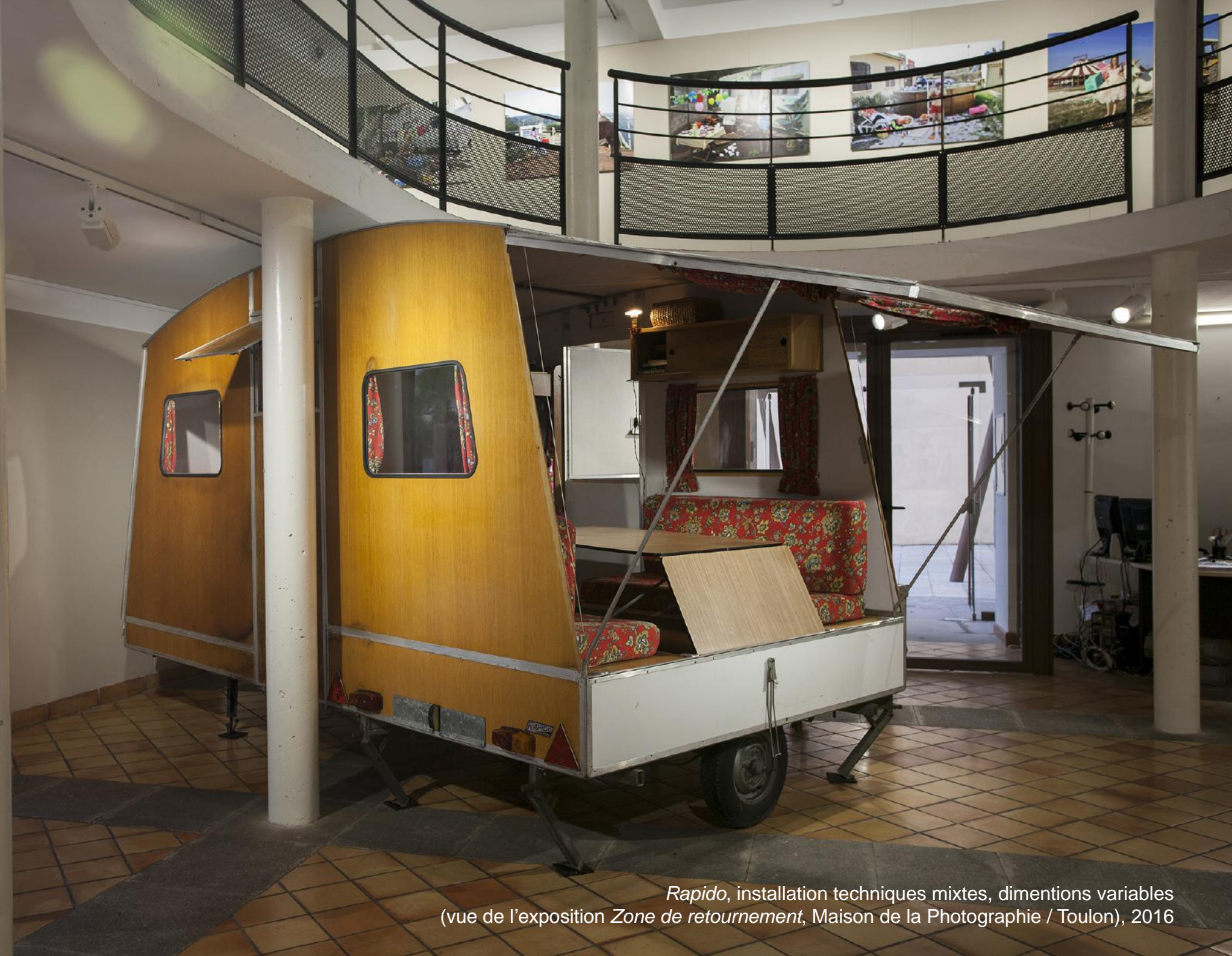
Rapido , installation techniques mixtes, dimensions variables (vue de l'exposition Zone de retournement , Maison de la Photographie / Toulon), 2016