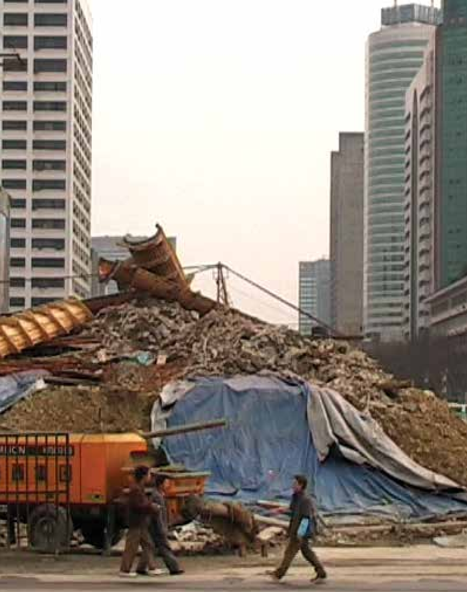
Ping Pong Master Player, 2006-2007 Vidéo, 16'30"