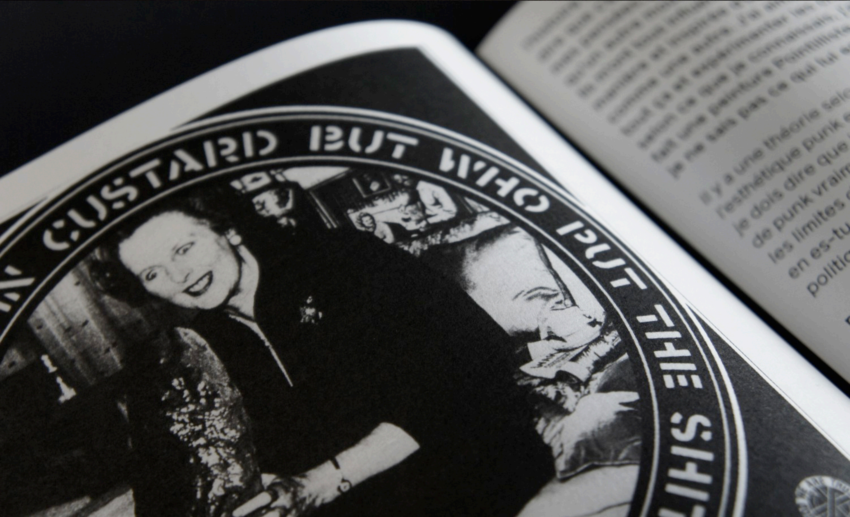
Revue "OpticalSound Numéro Un", rédacteurs en chef Pierre Beloüin & P.Nicolas Ledoux, Couverture cartonnée - 244 Pages - n°br - Format 17,5 x 24 x 2cm, 2013