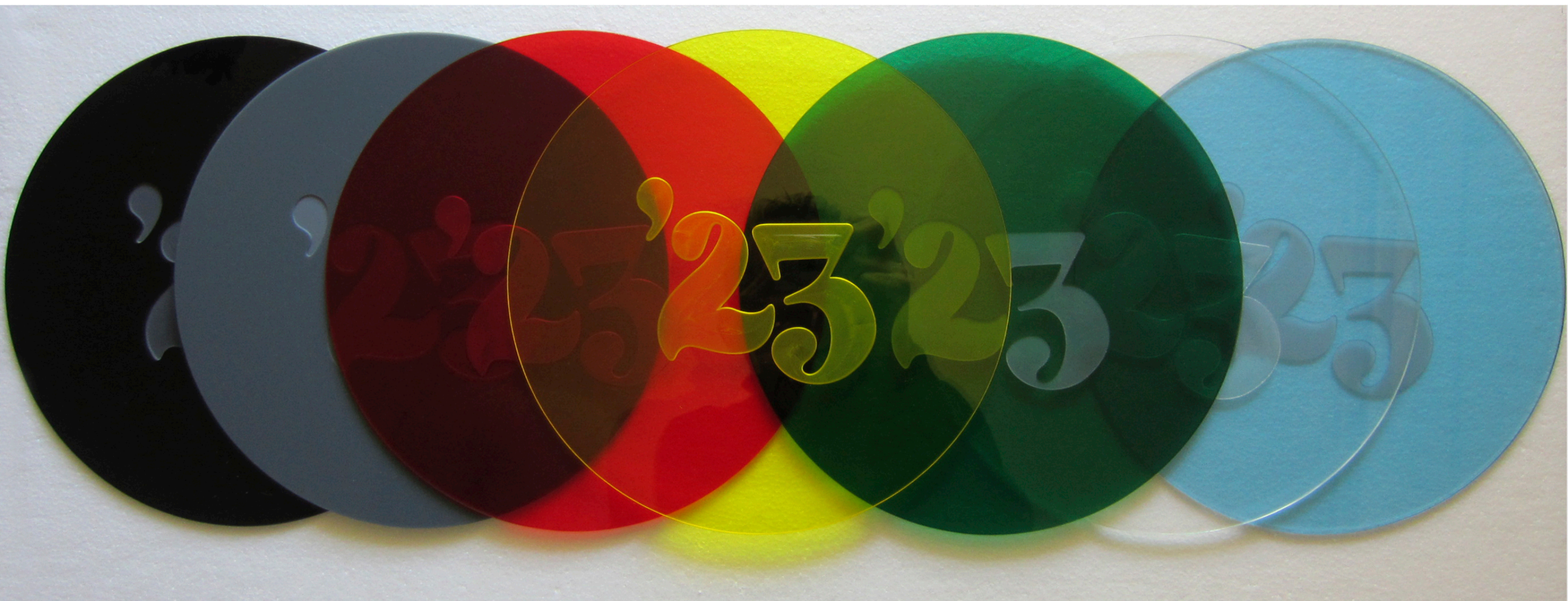
Pierre Beloüin, multiple Sept disques transparents et diffusants en polyméthacrylate de méthyle, teintés dans la masse gravure laser en défoncé d'une typographie originale et dessinée épaisseur 3mm, diamètre 230mm, arêtes chanfreinées première série datée de 2013, édition de trois.