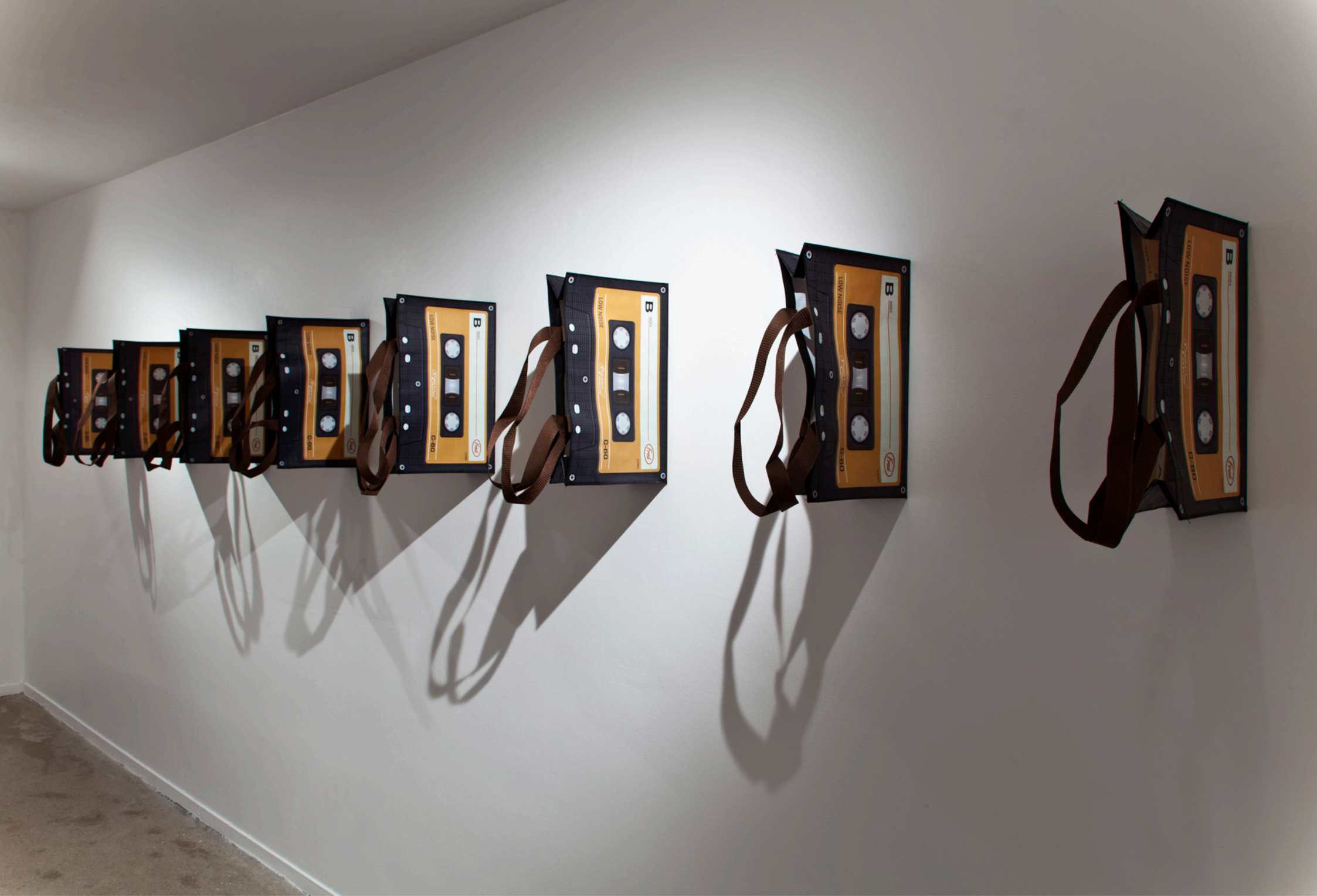
“K7 Wave”, sacs en polypropylène contrecollés sur mur, exposition “Vague Froide”, 2010, Wharf Centre d’Art Contemporain de Basse Normandie