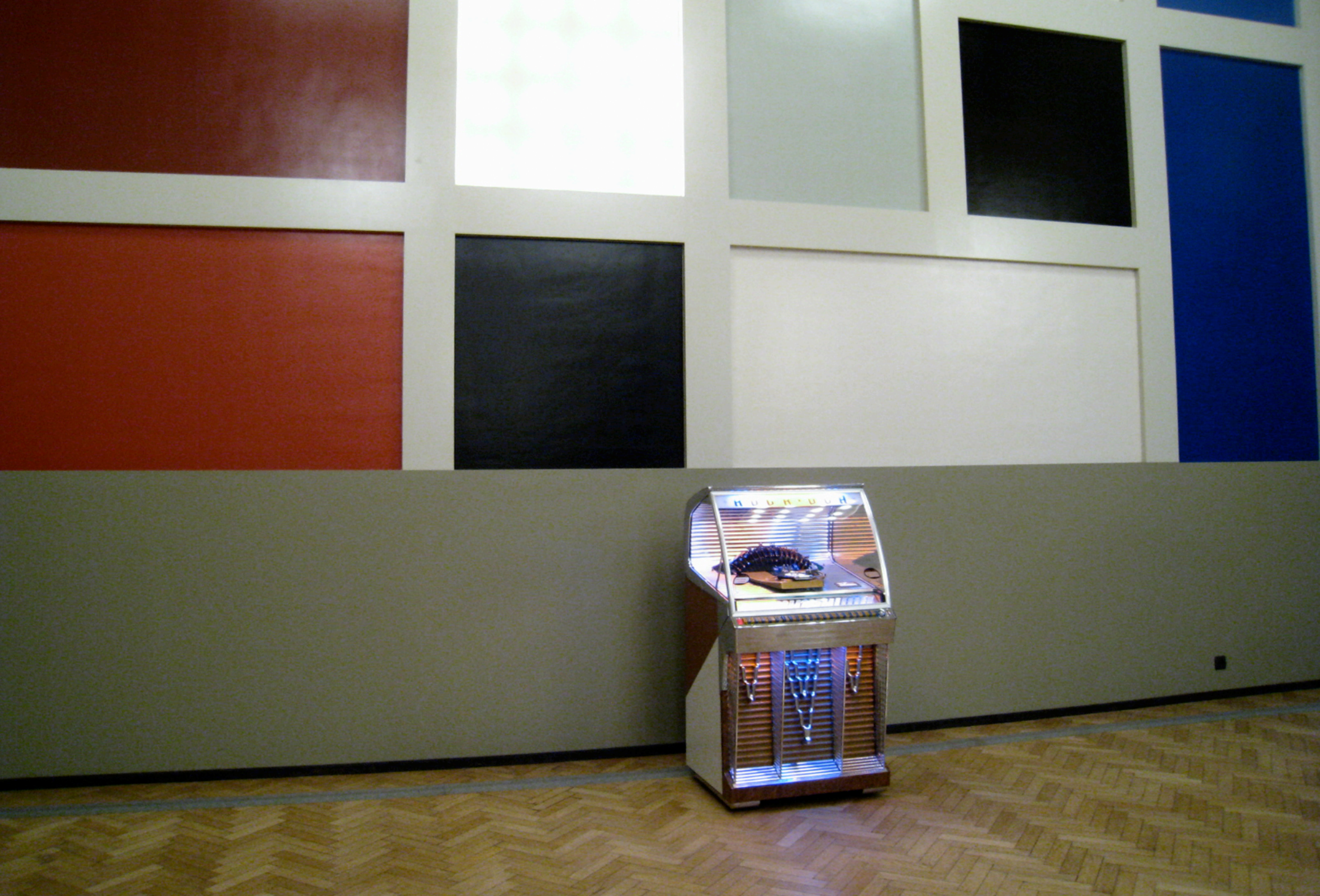
Ghost Juke Box, installation Optical Sound, Salle de l'Aubette (salle de bal), diffusion des créations 45t de Norscq, Ultra Milkmaids, Thierry Weyd, exposition L'Europe des Esprits, 2011, Strasbourg