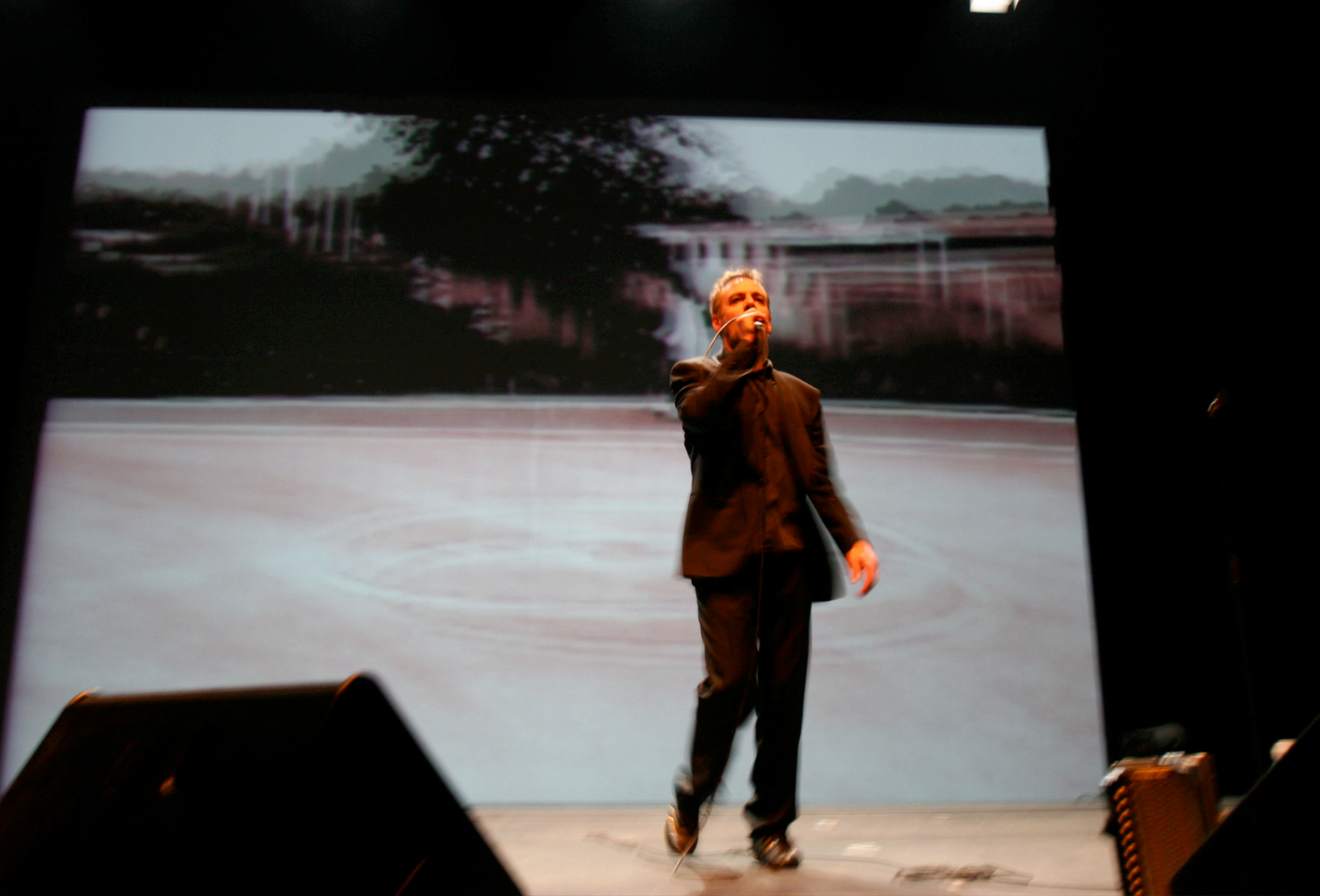
Concert Clair Obscur, Previously on Optical Sound, anniversaire des dix ans du label, dans le cadre de la ré-ouverture de la Maison des Métallos, 2008, Paris