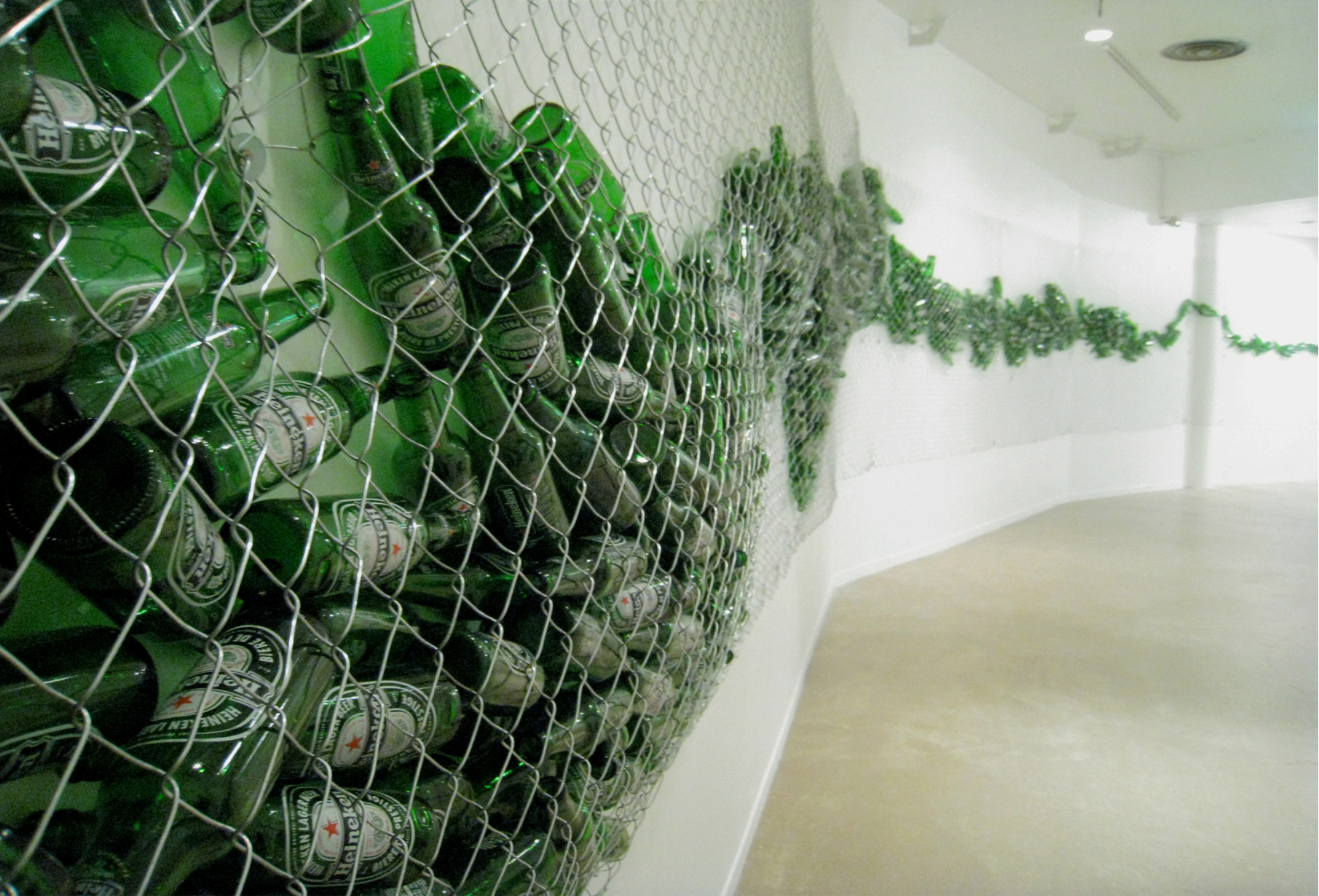
“Bas-relief (pour Claude Lévêque)” Grillage, canettes de bière vides, dimensions variables (ici : 2100 x 260 cm) Wharf, Centre d'art contemporain de Basse-Normandie, 2011