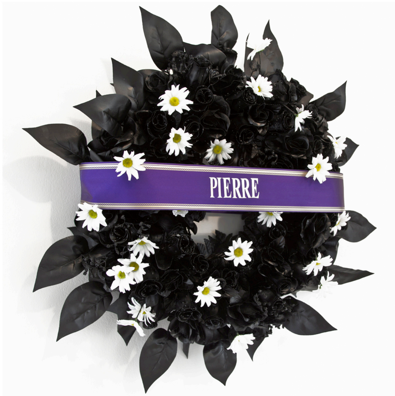
Couronne mortuaire peinte en noir, ruban et typographie; diamètre 80 cm, seconde édition, dans le cadre du festival Electron, commissariat Éléna Montesinos, Genève, 2017