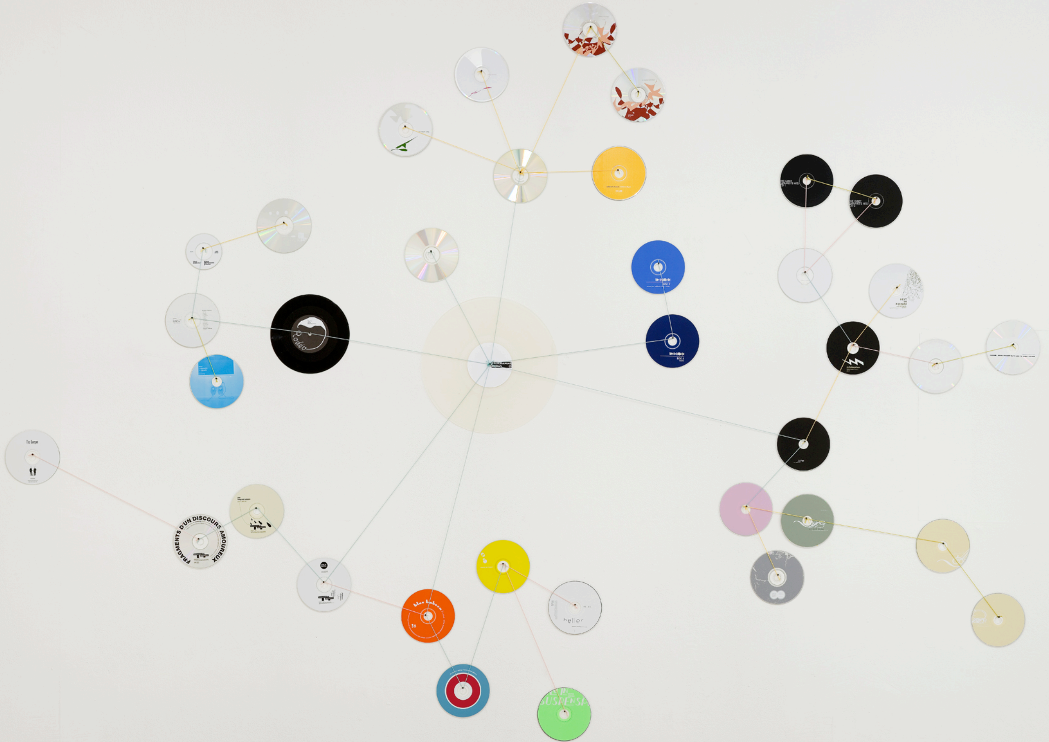
"The Circulating Library", avec Claire Moreux & Olivier Huz 35 Cds, 2 vinyls, fil de coton Vue de l'exposition Persistence is all, 2008, FRAC PACA