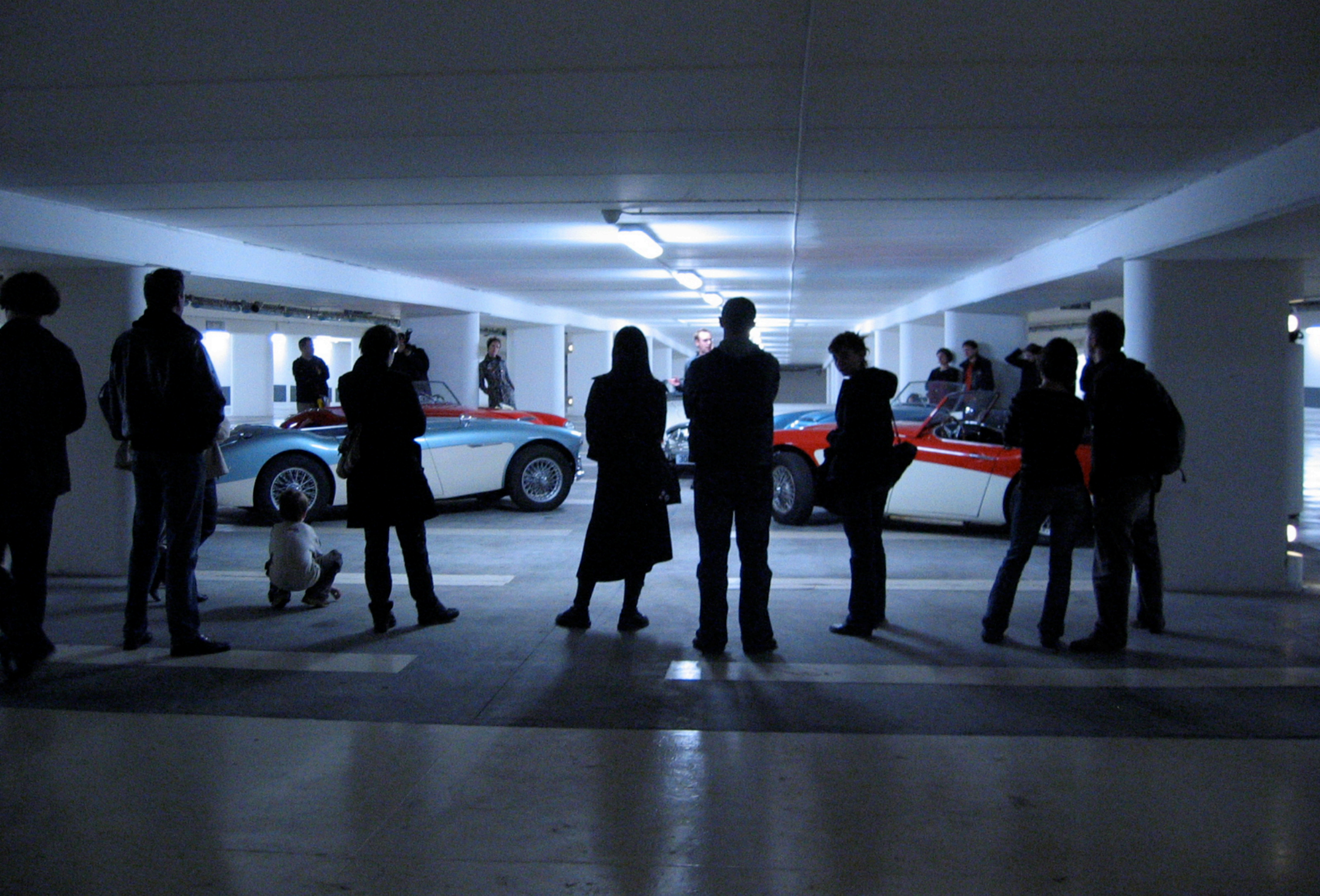
"Str Crsh, Performance, sept Austin Healey avec chauffeurs, diffusion sonore par autoradios et lecture performance, avec Cocoon, Norscq, et Black Sifichi, Parking du MAMCS, 2007, Strasbourg