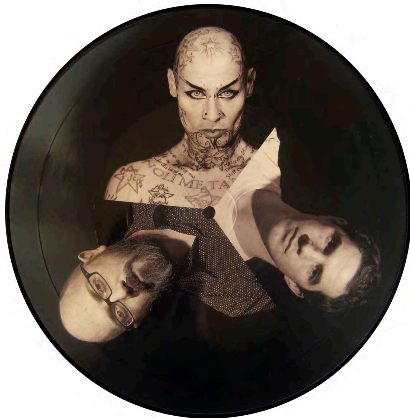
"I Apologize", picture disc 10" (OS.060), cinq titres, design graphique Huz and Bosshard, 300 exemplaires 2012