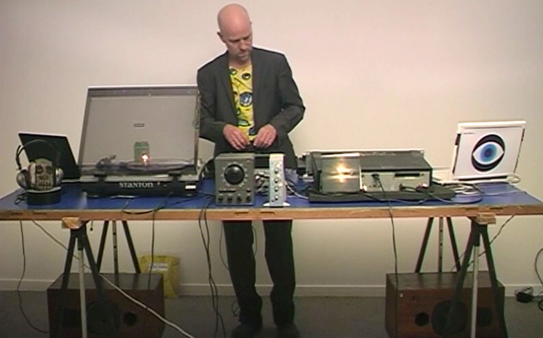
"Black Sifichi continuous Mix" concept Optical Sound, réalisation Jérôme Lefdup, vidéo projection en boucle échelle un, 1'59, exposition "Previously On Optical Sound" Galerie Frédéric Giroux, 2010, Paris