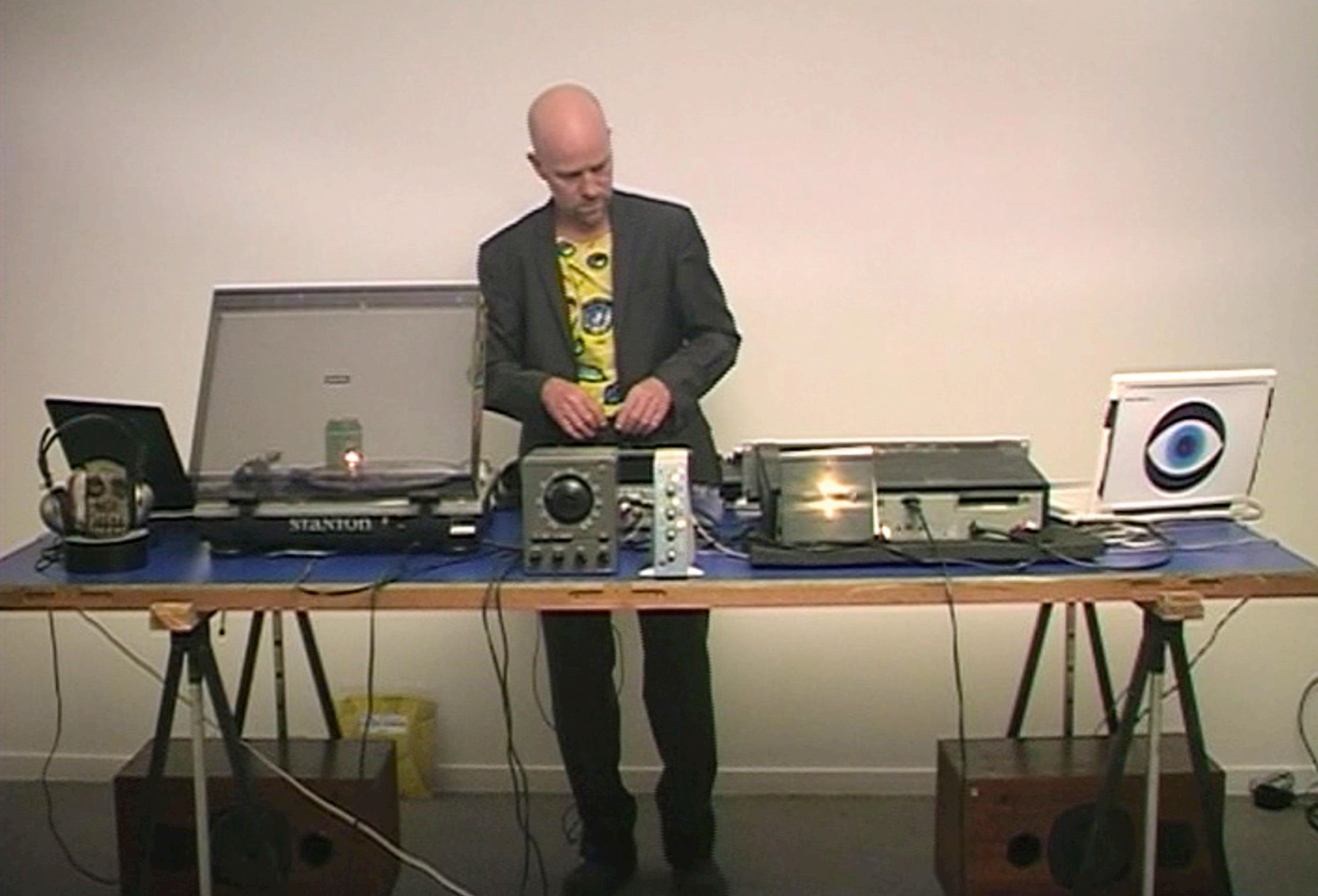
"Black Sifichi continuous Mix" concept Optical Sound, réalisation Jérôme Lefdup, vidéo projection en boucle échelle un, 1'59, exposition "Previously On Optical Sound" Galerie Frédéric Giroux, 2010, Paris