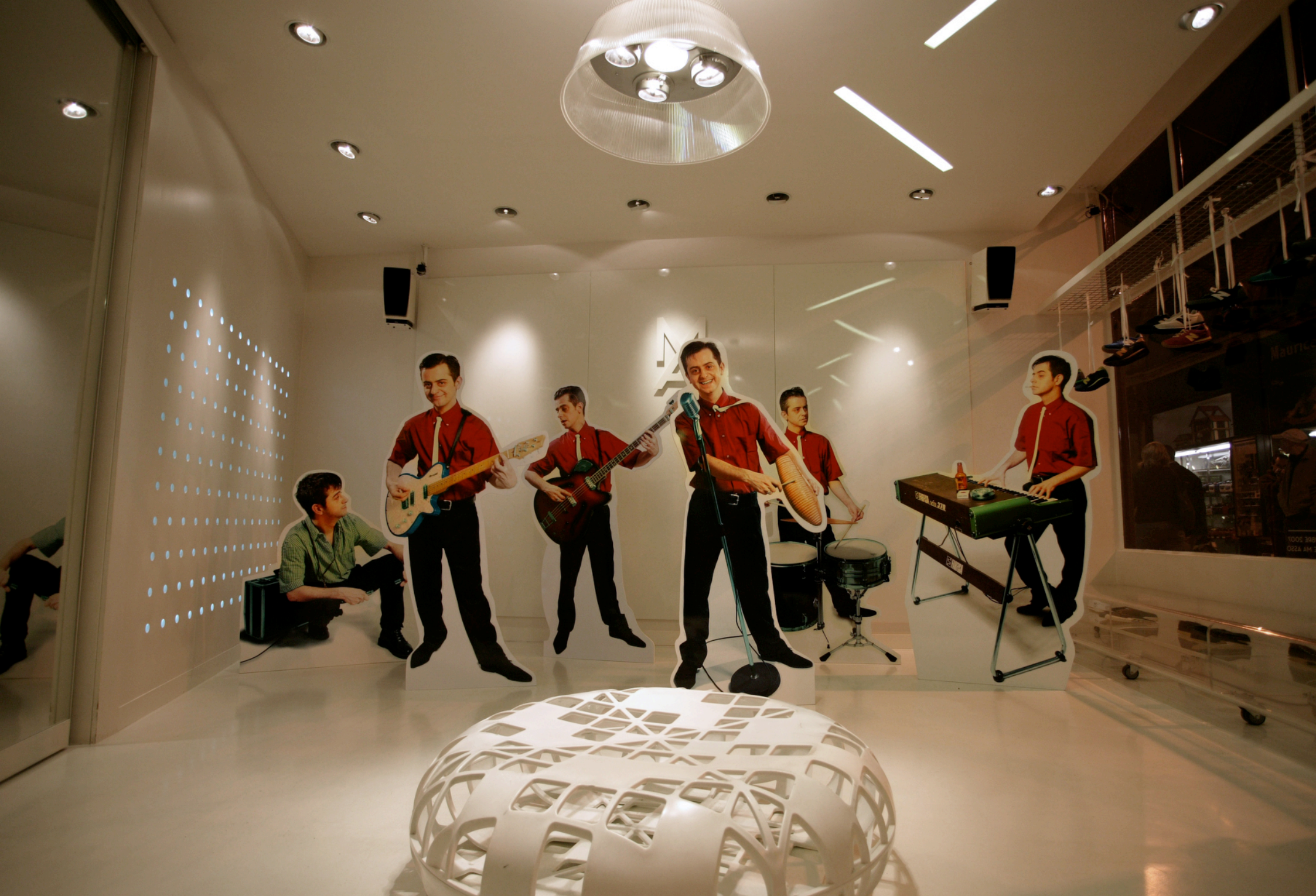
"L'Homme Orchestre V.2" (Exotica version) 175 x 90 cm environ chaque personnage, éclairage, bande son, 2005, M.A, Bordeaux