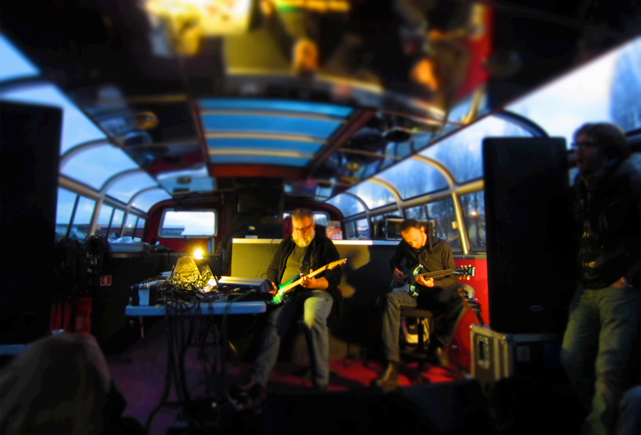
“Échos Flottants #20” Robin Guthrie & Steeve Wheeler, concerts pour bateaux mouches, principe et programmation Optical Sound / 2012, Ososphère, Strasbourg