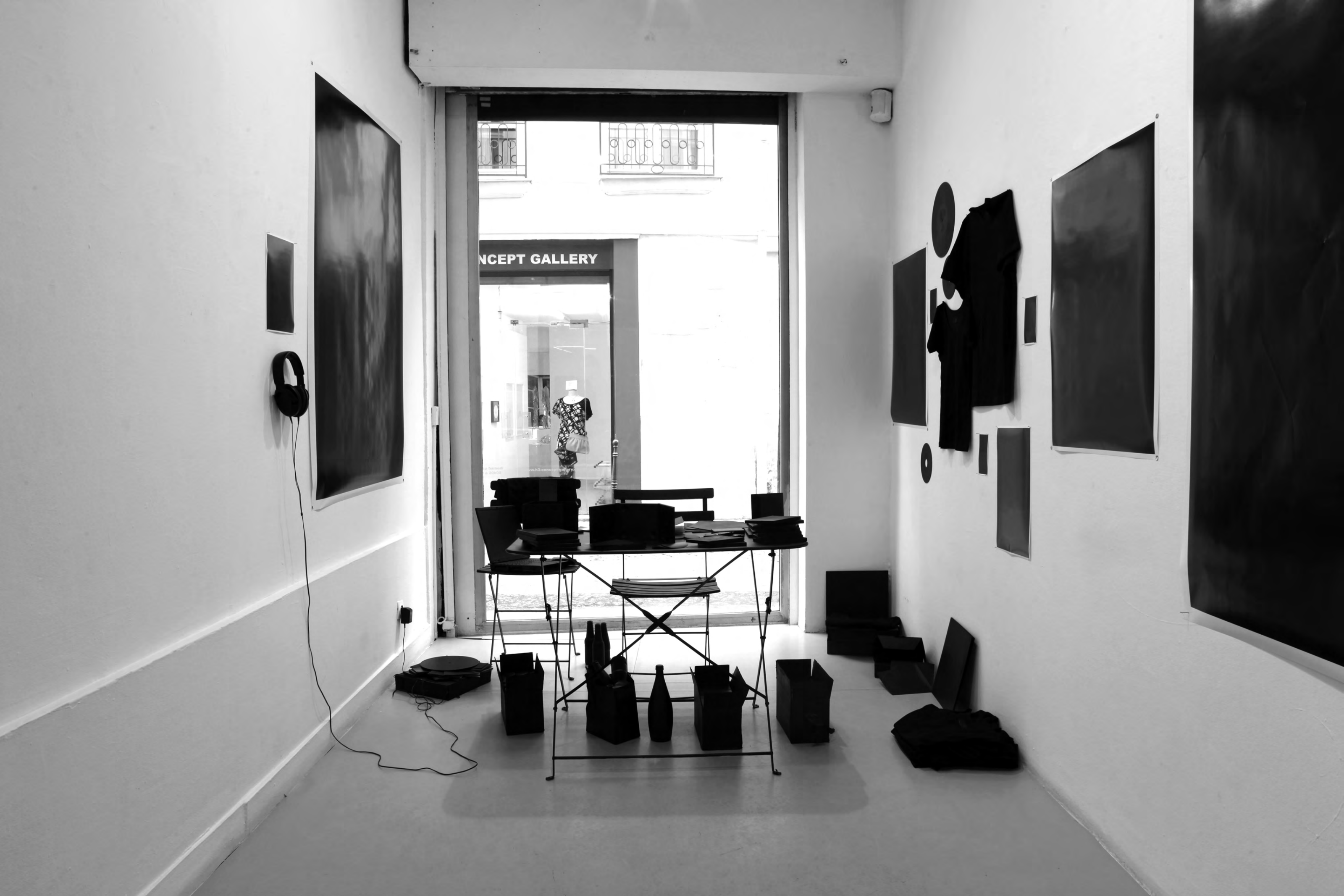
The Ultimate Exhibition of Definitive Black Rock Core ! 2011 Impressions numériques, objets divers, peintures noires, bande sonore, etc. avec P. Nicolas Ledoux Vues de l'exposition Musique plastique, Galerie du jour, agnès b., Paris, Photographie Laura Morsch