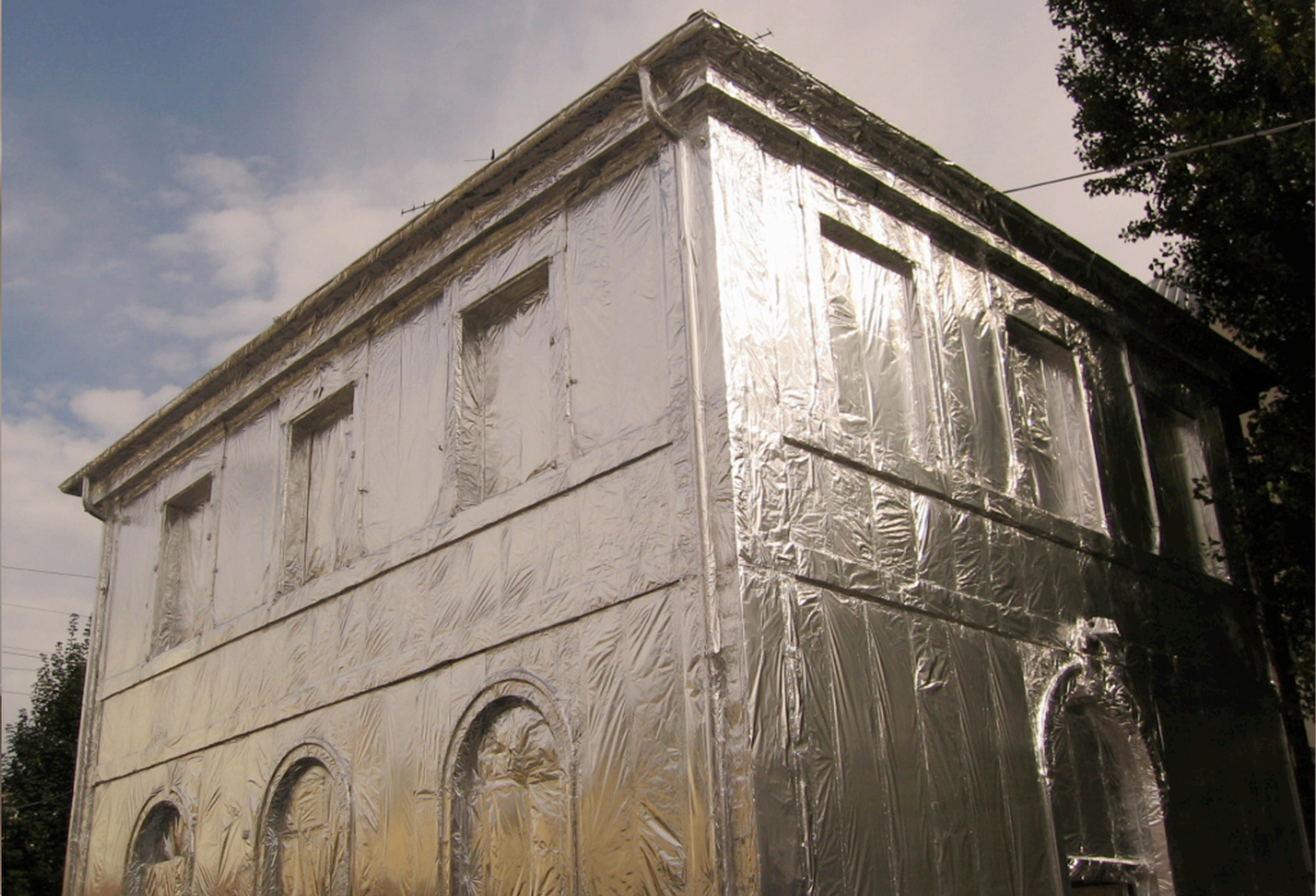
"I'll Be Your Mirror" (Factory inversée) Pavillon recouvert de papier aluminium, dimensions variables, Ososphère 2005, Strasbourg