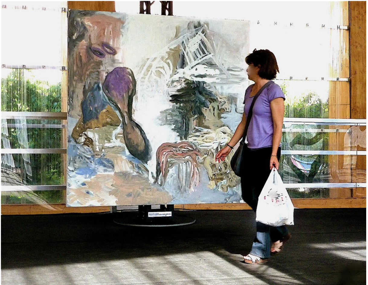
Exposition – PAVILLON M – Marseille 2013