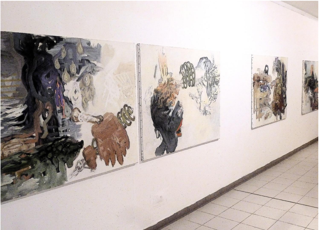
Exposition Hors-les-Murs – Marseille 2013