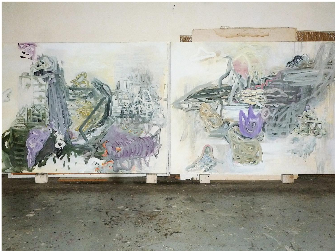
N° XXXIV /XXXIII – Détrempe, liant acrylique sur toile de lin