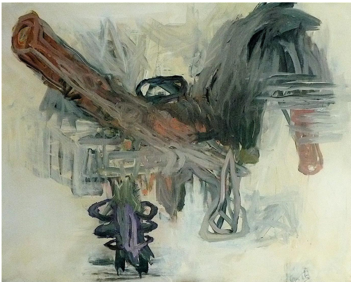
N° XXXI – Détrempé, liant acrylique sur toile de lin.