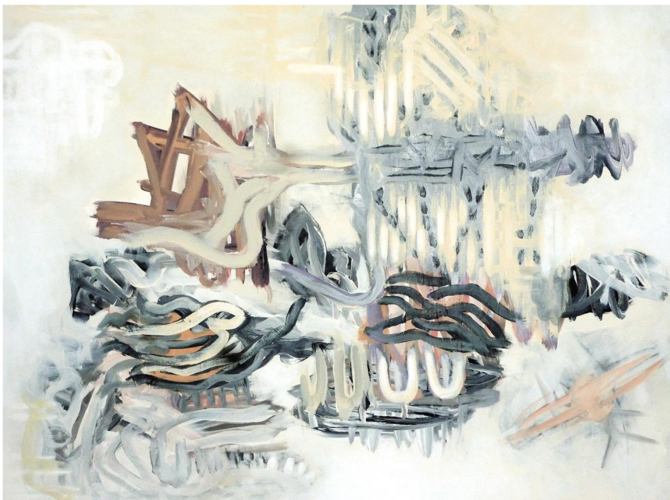
N° XXXII – Détrempe, liant acrylique sur toile de lin