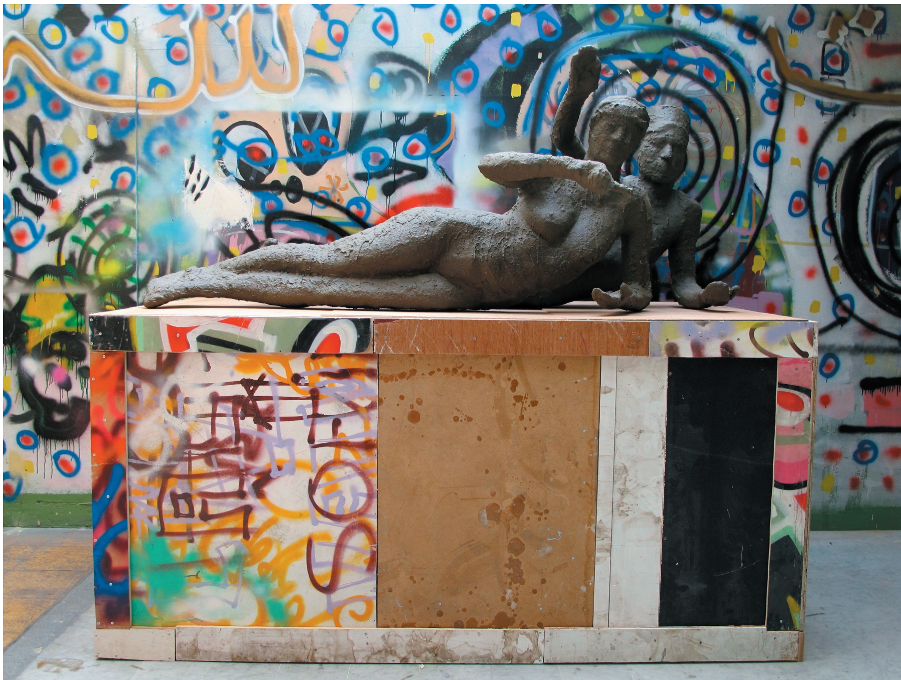
Sans titre (l'antico sorriso etrusco e le vestigia del futuro)