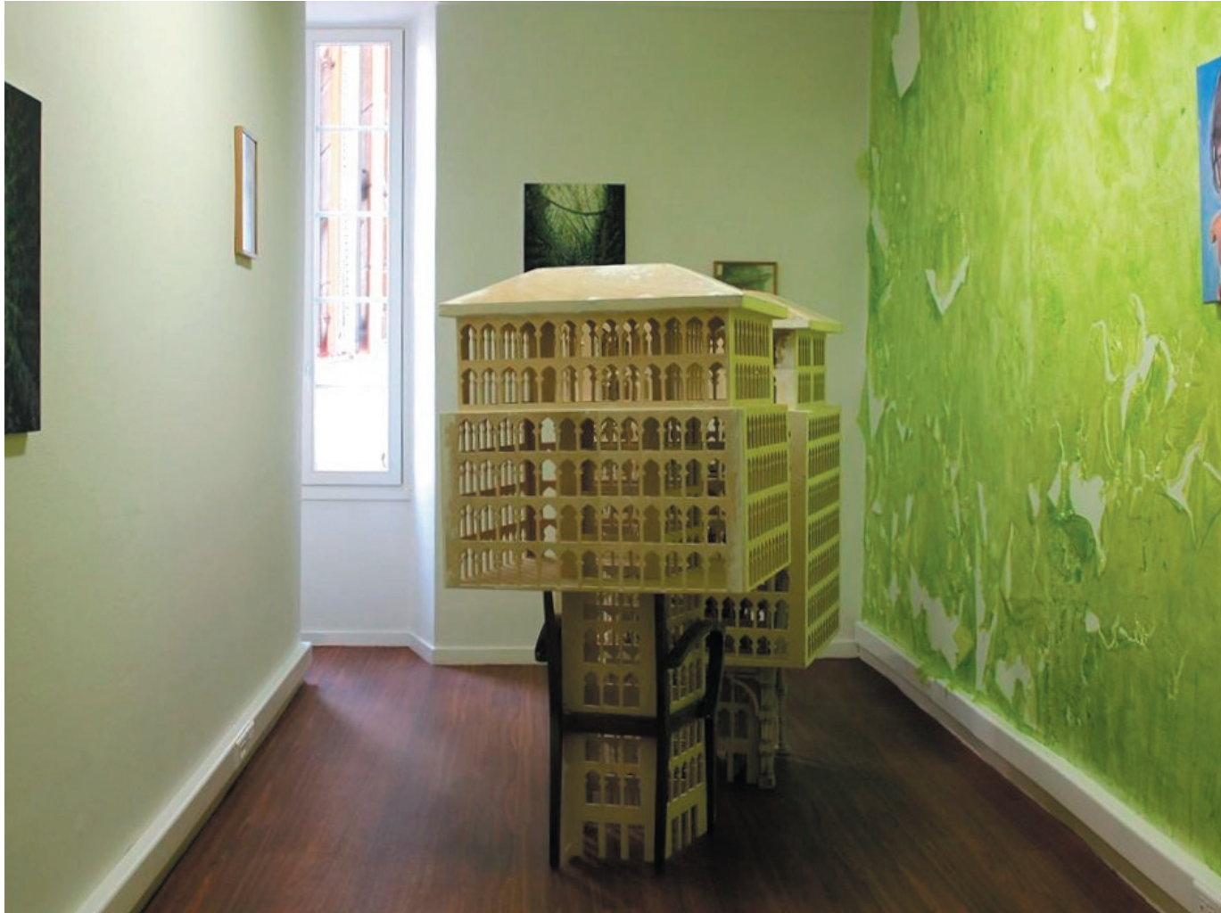
Sans titre (El Atlal : les ruines)