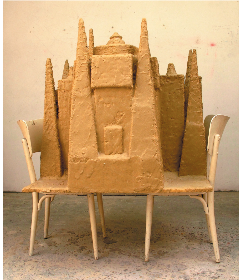
Sans titre (Au désert j'ai dû me rendre) 2013