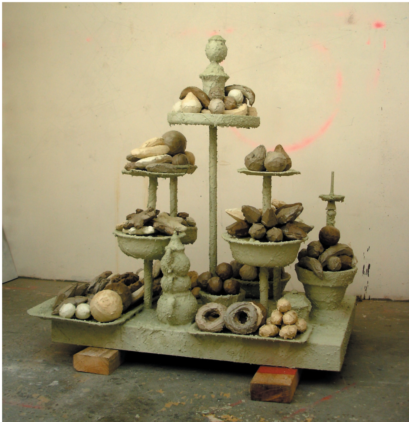
Sans titre (Turkish Delight)