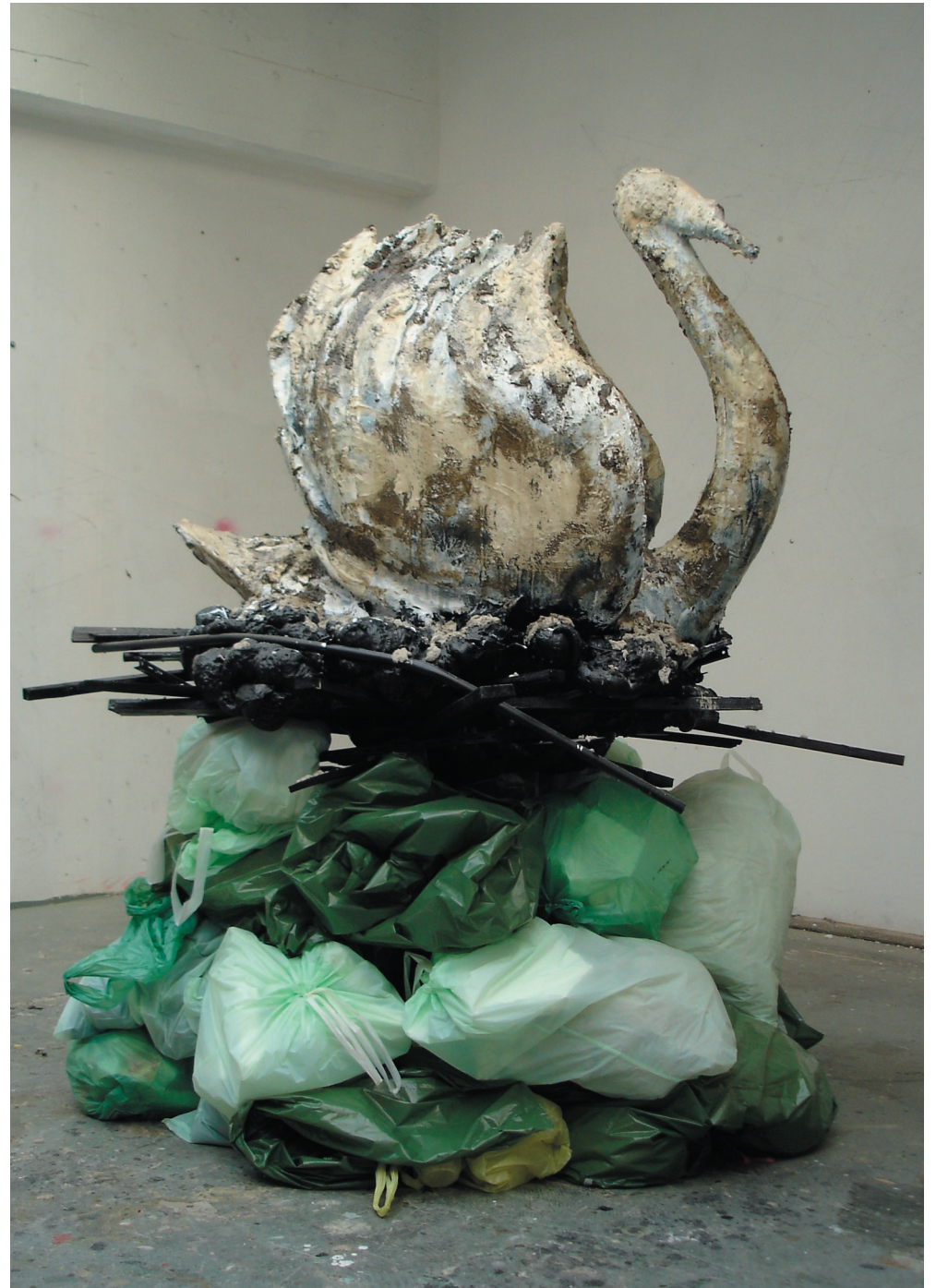
Sans titre (Descendu des hauteurs où règne la lumière) 2008