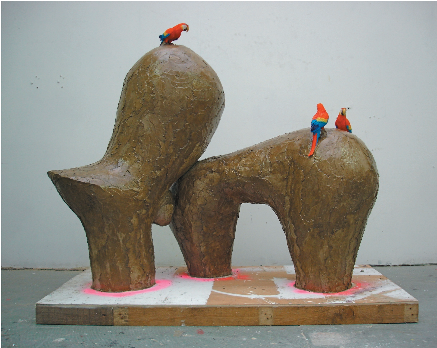
Sans titre (ô jardim botânico tropical) /2