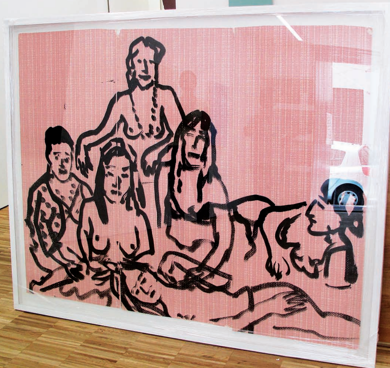
Abeille et câlin, Les filles 3, encre de Chine sur papier peint, 130 x 159 cm, 2015 Réception des cadres, galerie Béa-ba