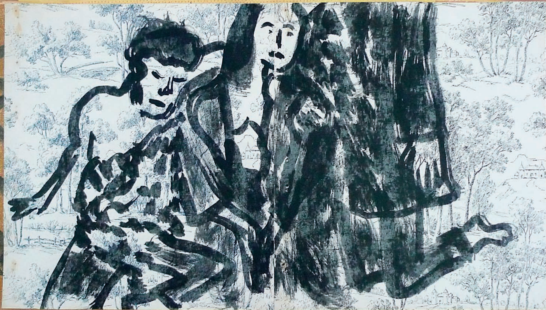
Abeille et câlin Ben, Raphaële et Alexandre, encre de Chine sur papier peint, 59 x 105 cm, 2015