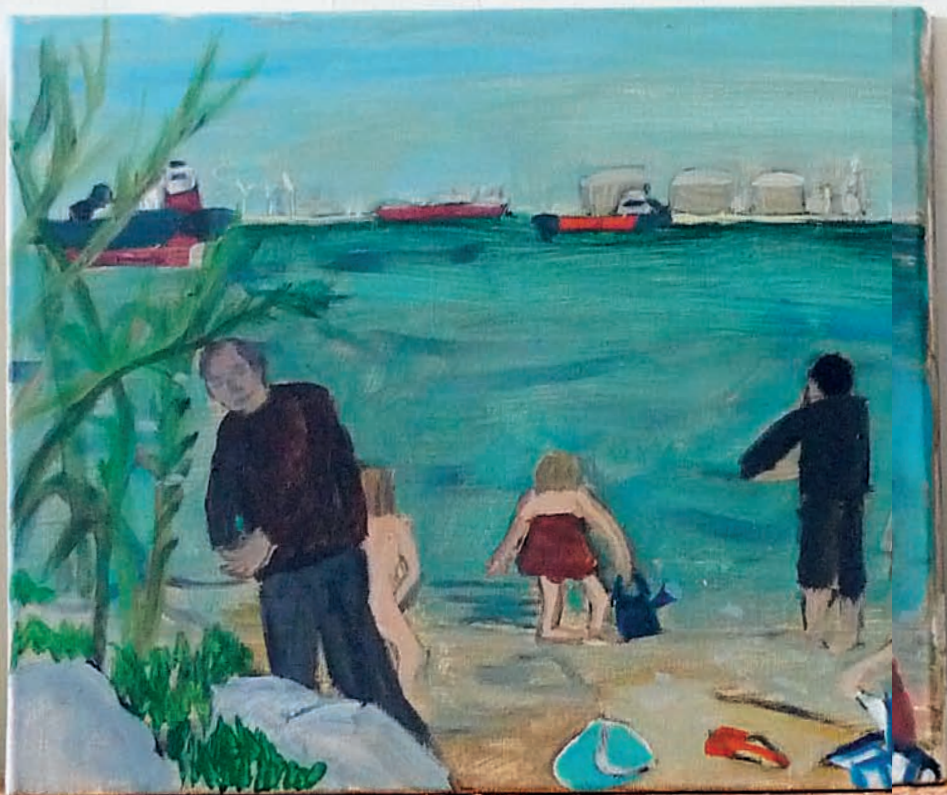
Abeille et câlin Port-de-Bouc 3 et 4, acrylique sur toile, 40 x 50 cm, 2015