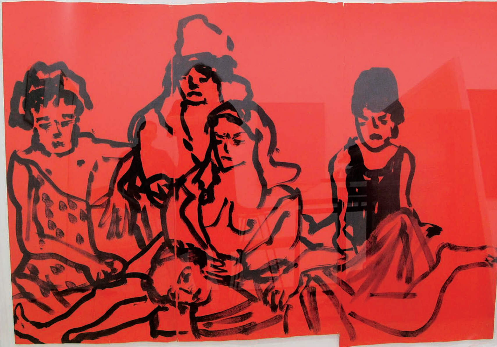
Abeille et câlin, Groupe 2, encre de Chine sur papier peint, 130 x 159 cm, 2015