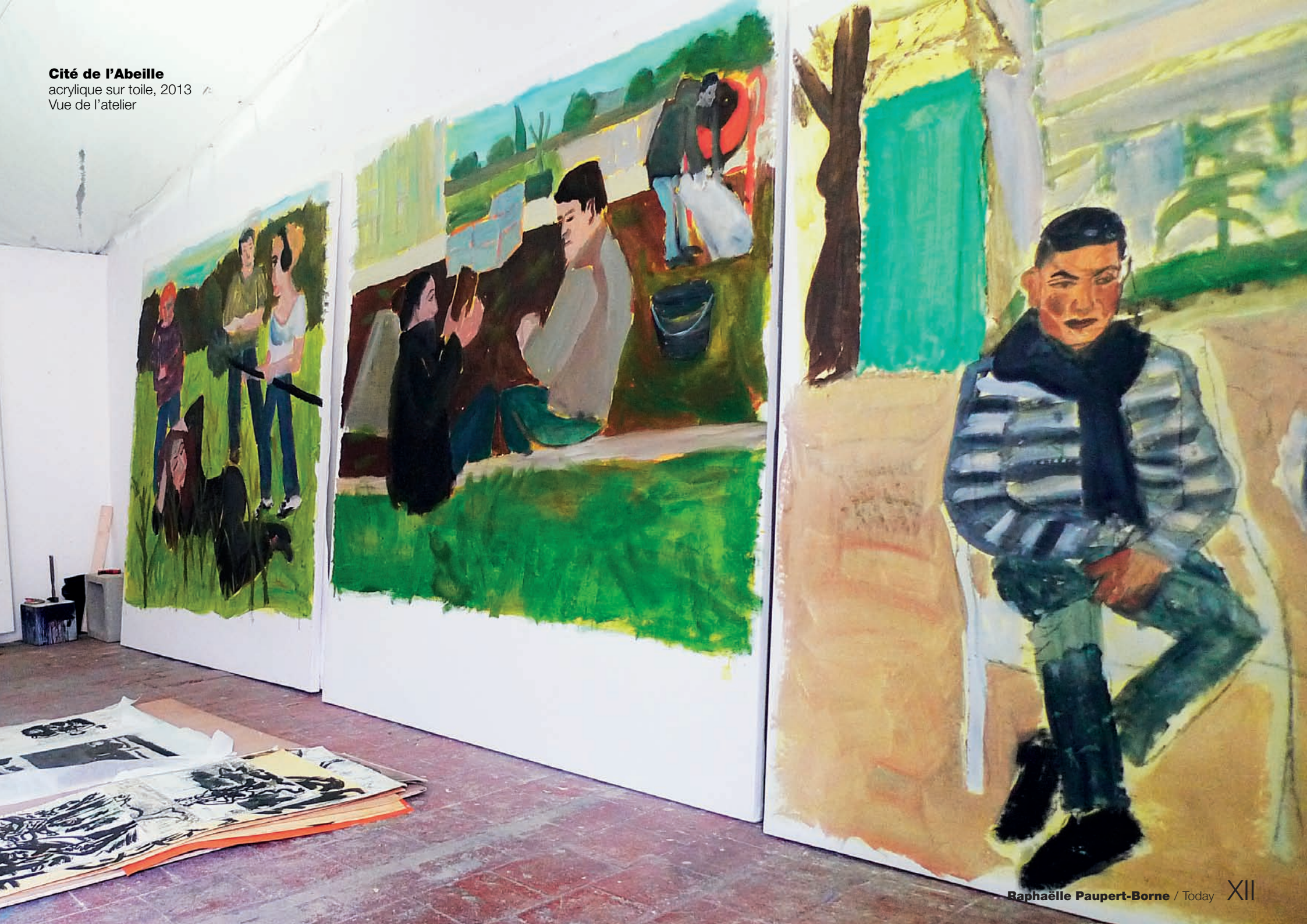
Cité de l'Abeille acrylique sur toile, 2013 Vue de l'atelier