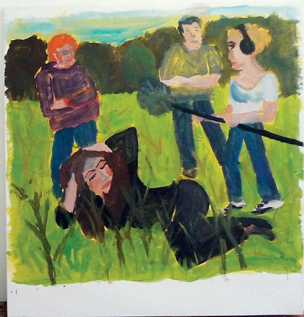
Cité de l'Abeille Dans le champs, La Ciotat, acrylique sur toile, 214 x 240 cm, 2013