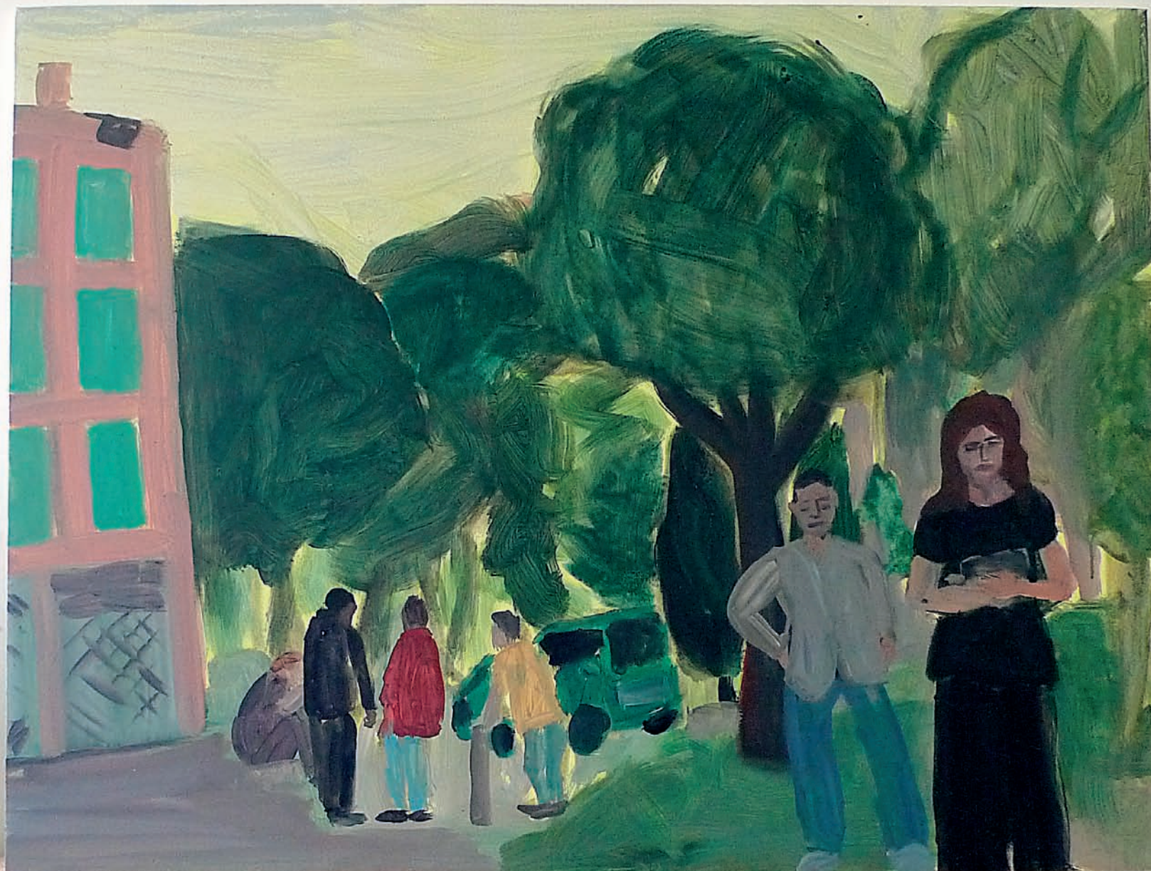
Cité de l'Abeille Brigitte, le peintre et les marchands, acrylique sur toile, 95 x 125 cm, 2013