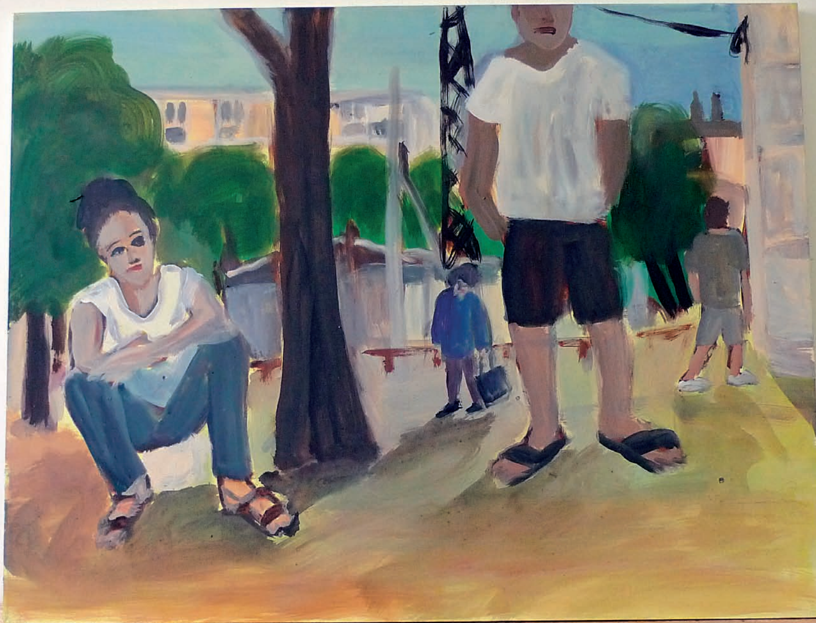
Cité de l'Abeille Yasmina et les garçons, acrylique sur toile, 95 x 125 cm, 2013