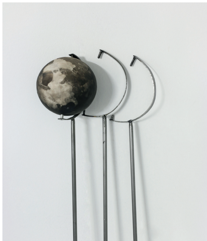
[2] "ATLAS ERRANT" — CAROLINE TRUCCO

les terres, mais aussi à prendre en main le monde pour mieux l'appréhender dans Atlas errant (2015) [2].