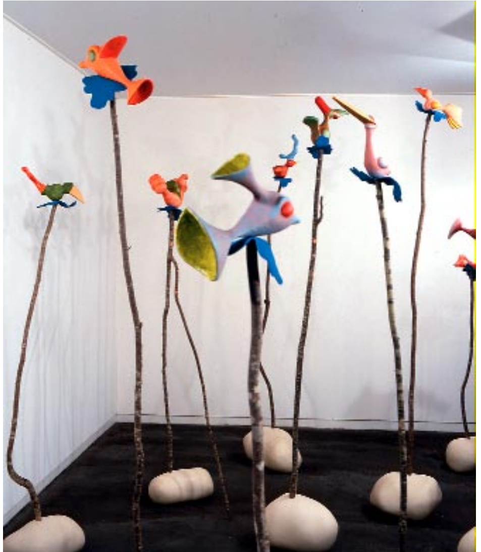
Sommets , 1996

Bois, pâte à papier, plâtre, hauteur 1,20 à 2,30 m