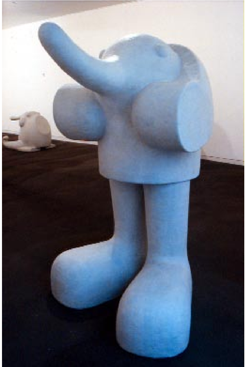
Air d'onde gibbeuse , 1998