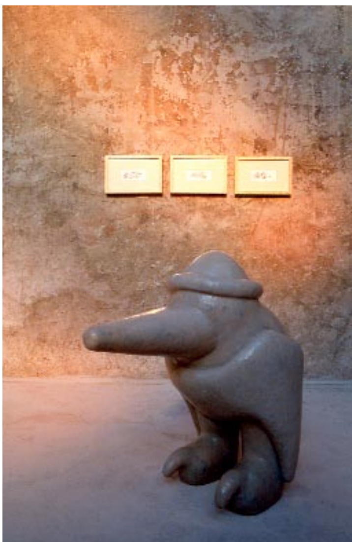
Sans titre , 1989 Polyester stratifié, hauteur 120 cm Collection privée