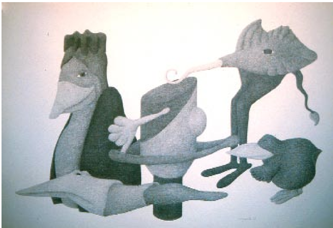
Sans titre , 1989

Mine de plomb sur papier, 32,5-x-49,5 cm