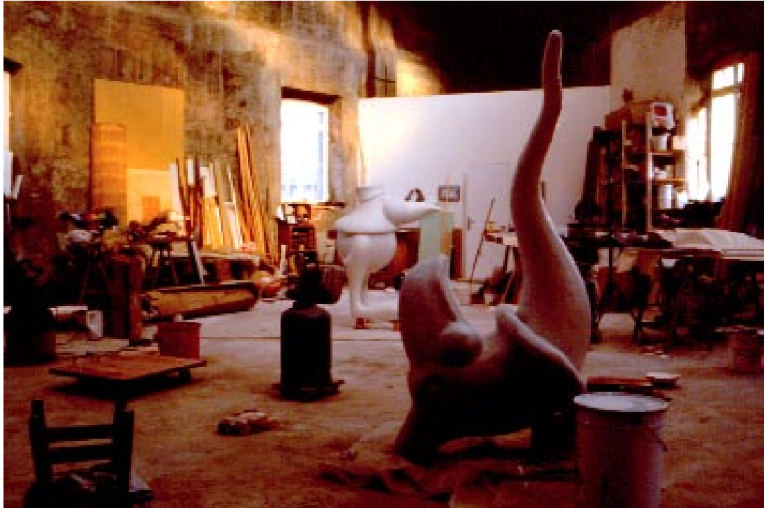
Vue d'atelier, 1992