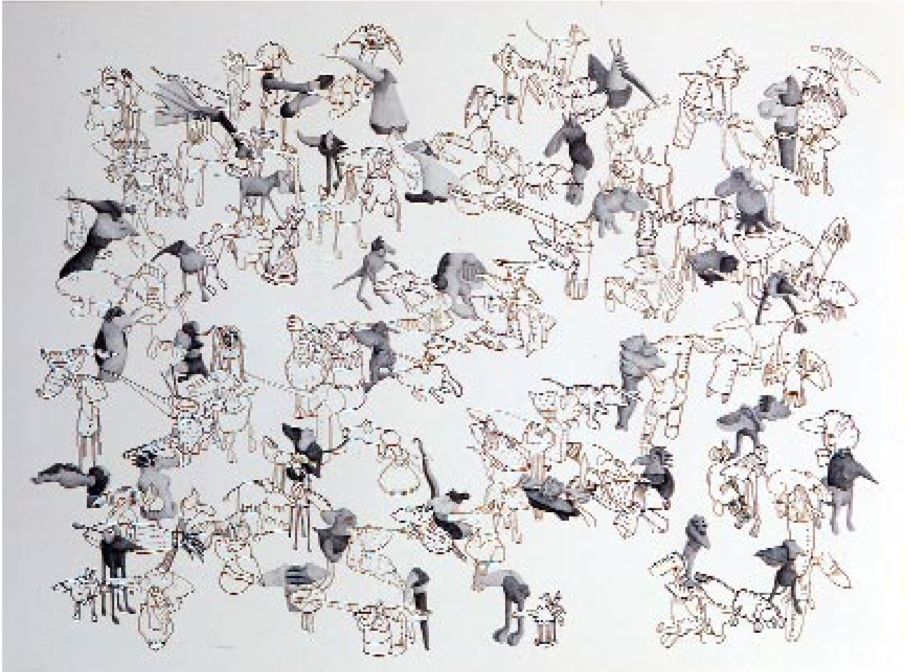
Sans titre , 1991 Mine de plomb et encre 56-x-70 cm