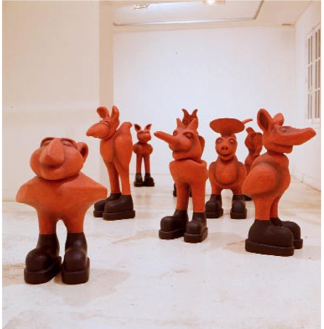
Qui vive ! , 1993 Polyester stratifié peint, hauteur de 80 à 110 cm