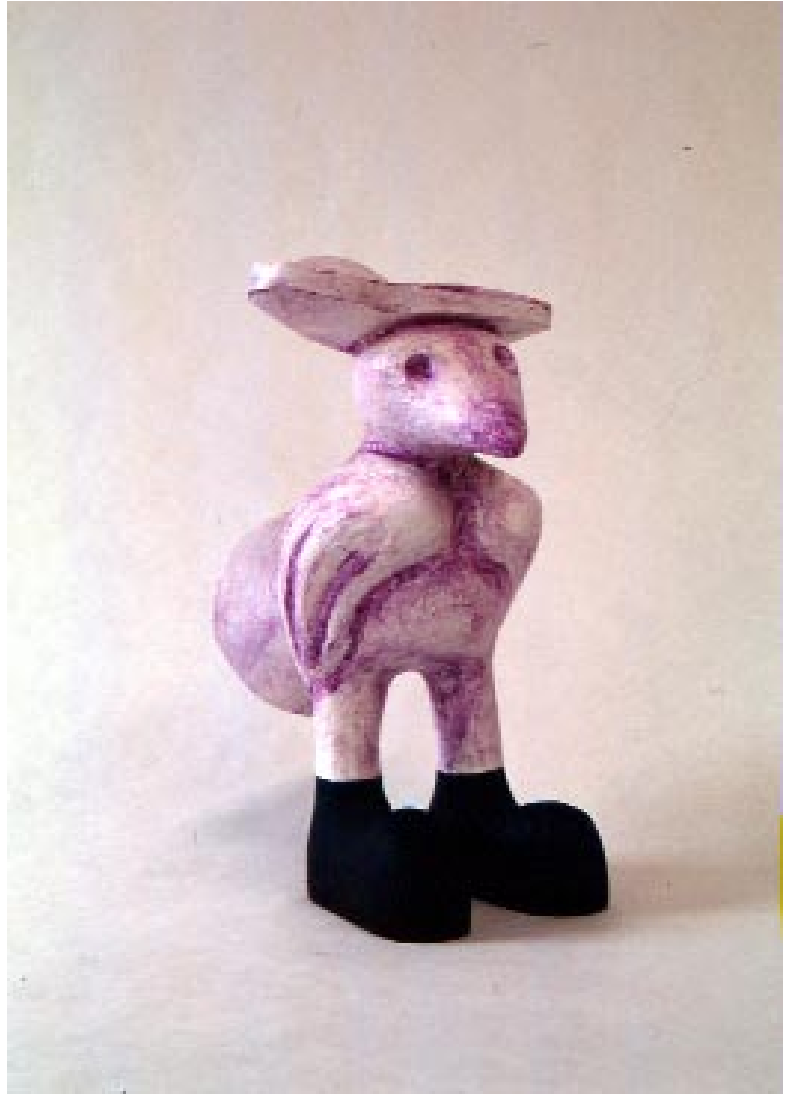
Et le monde va , 1993 Détail

Collection Frac Paca