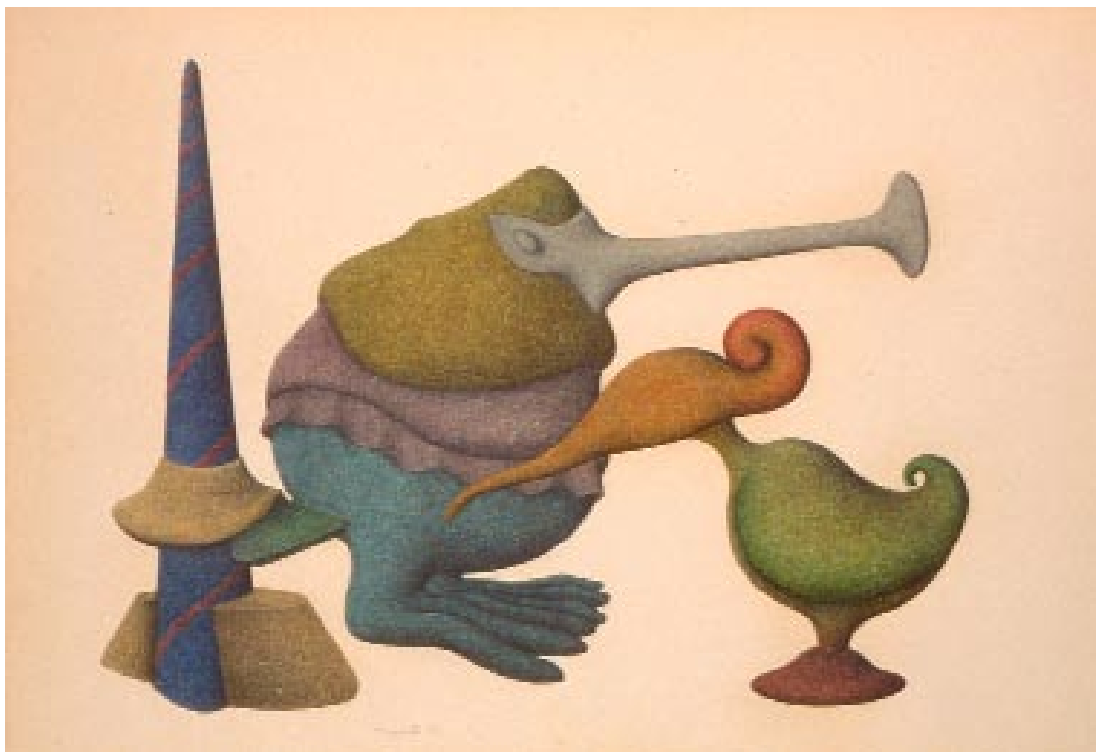
Sans titre , 1989

Crayons de couleur et mine de plomb, 32,5-x-49,5 cm