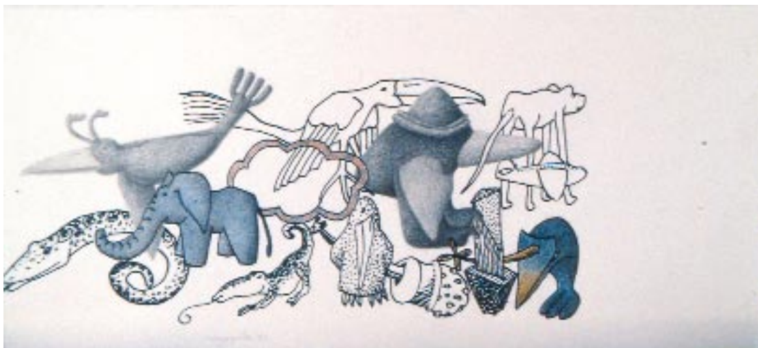
Sans titre , 1989 Encre de chine, crayons de couleur, mine de plomb sur papier, 9-x-20 cm