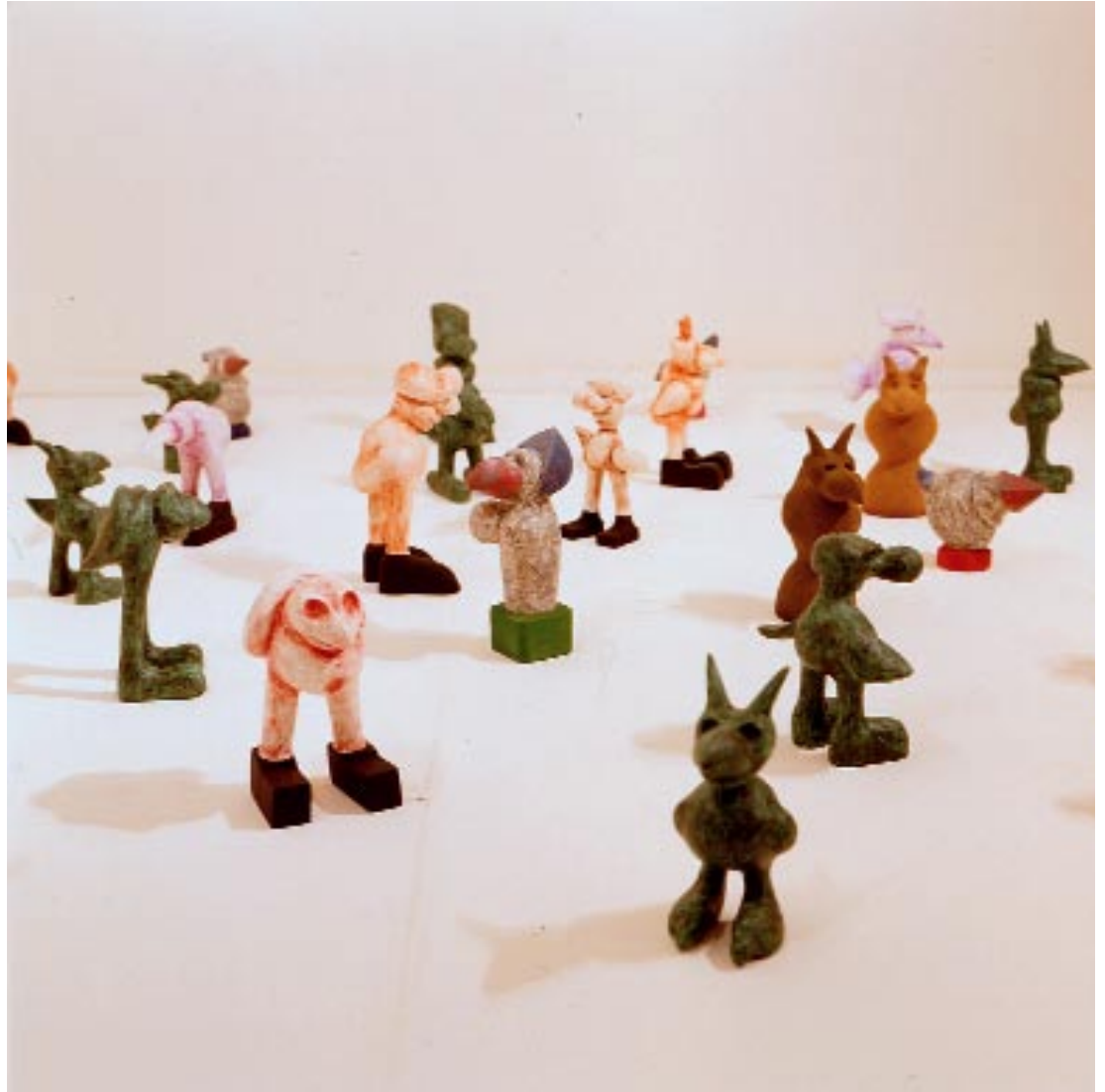
Et le monde va , 1993

Matériaux composites, 30 éléments, hauteur entre 30 et 60 cm