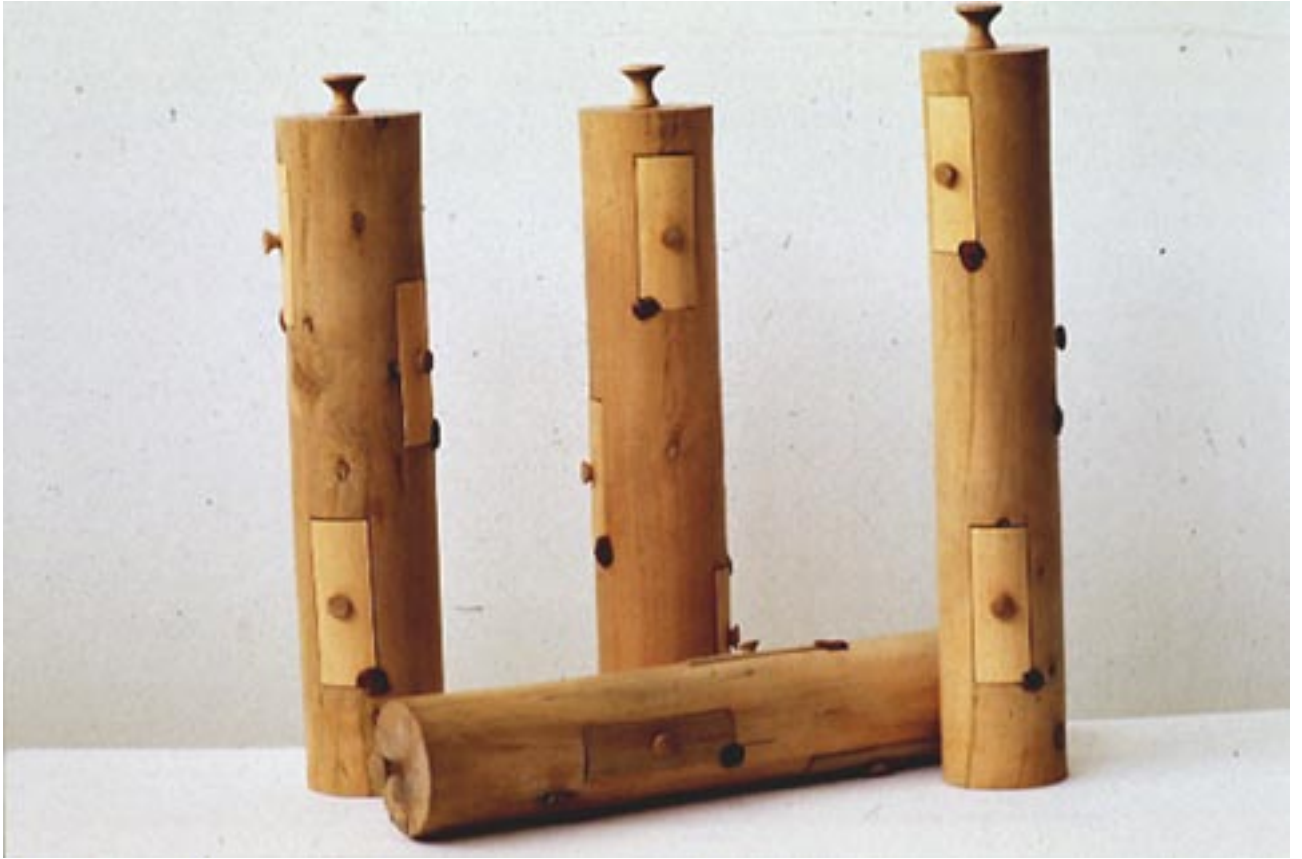
Cylindre , 1993

Bois d'acacia, tiroir, cire à cacheter, texte, divers objets, 53 x 11 cm chacun