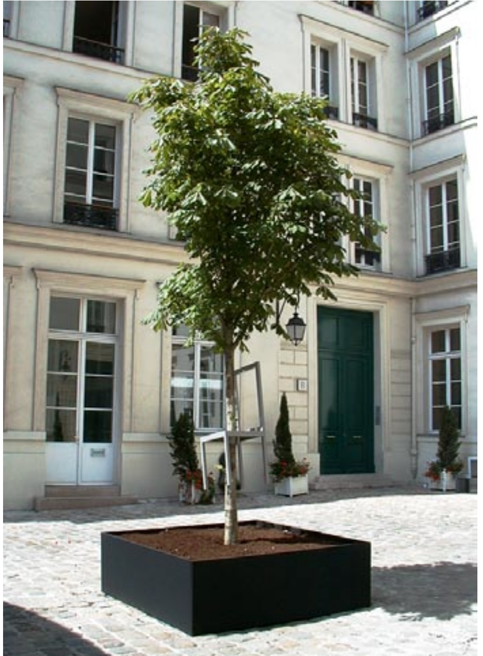
Sans titre , 1999 Aluminium, arbre Vue d'exposition au Passage du Retz, Paris Photographies B