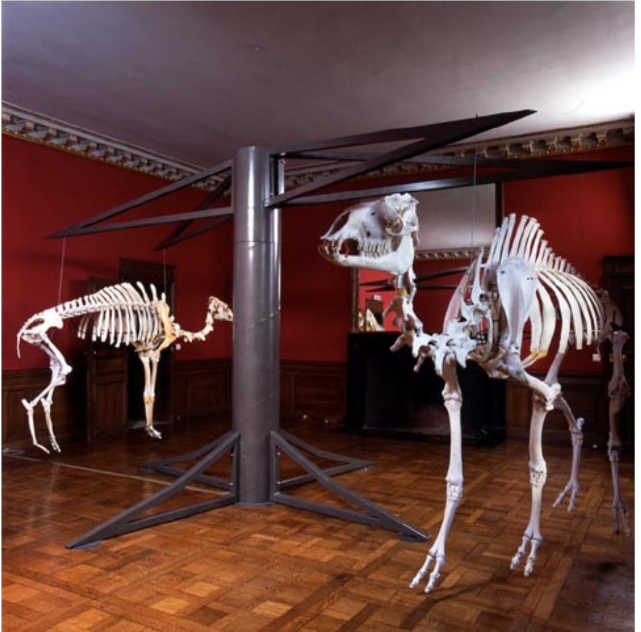
Quel est l'imbécile qui a quitté le monde des lumières sans couper l'interrupteur? , 2000

Acier, squelettes de dromadaire, 250 x 580 cm