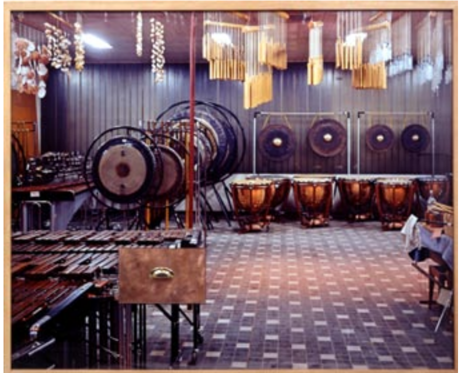
Sans titre , 1997 1,80 x 2 m