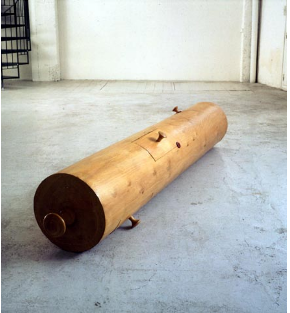
Cylindre , 1993

Bois d'acacia, tiroir, cire à cacheter, texte, divers objets, 53 x 11 cm chacun