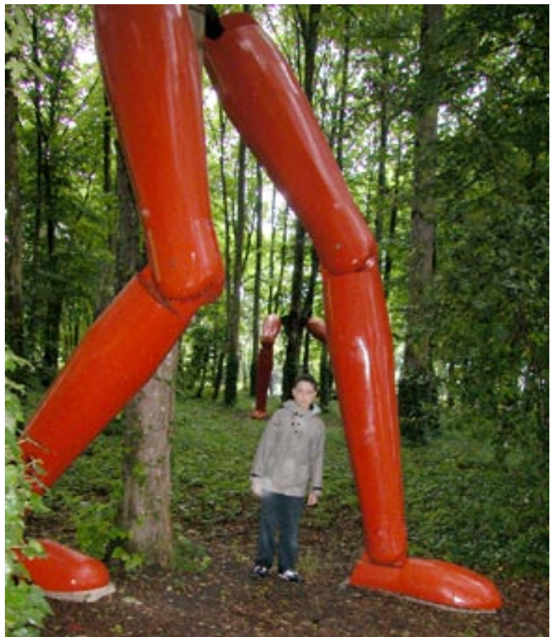
La Forêt qui marche , 2002 Technique de fuselage, bois Vues de l'exposition au château de Rivaux Photographies B