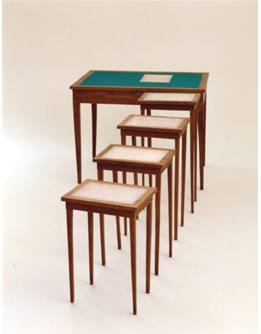
Feuille à feuille , 1994