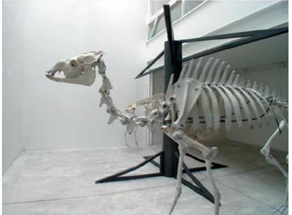
Quel est l'imbécile qui a quitté le monde des lumières sans couper l'interrupteur? , 2000 Acier, squelettes de dromadaire, 250 x 580 cm

Vue d'exposition à la Galerie Michel Rein