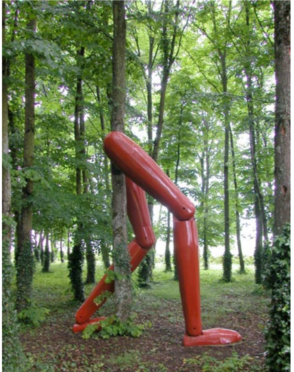
La Forêt qui marche , 2002 Technique de fuselage, bois Vue de l'exposition au château de Rivaux