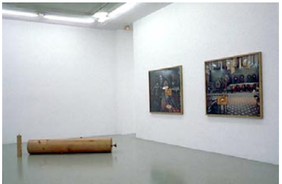
Vue d'exposition à l'IAC, Villeurbanne 1999