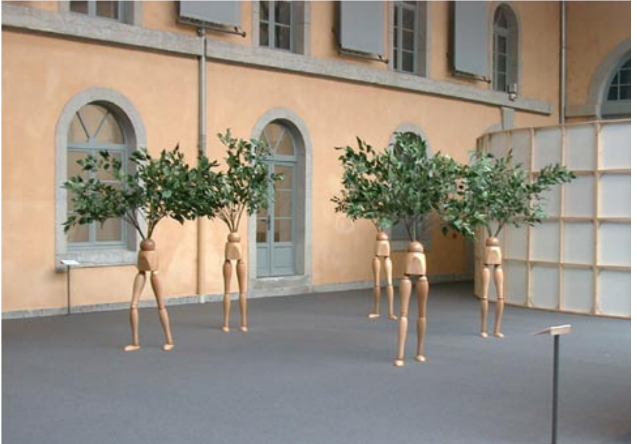
La forêt qui court (Dialogues) , 1994-1998

Bois, feuillage artificiel, 5 dialogues, 10 personnages 200 cm haut chaque élément