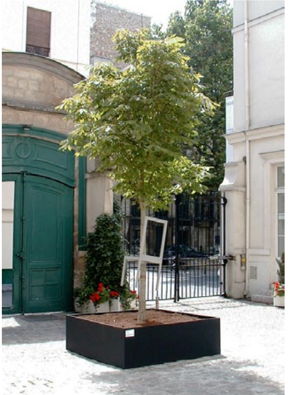
Sans titre , 1999 Aluminium, arbre Vue d'exposition au Passage du Retz, Paris