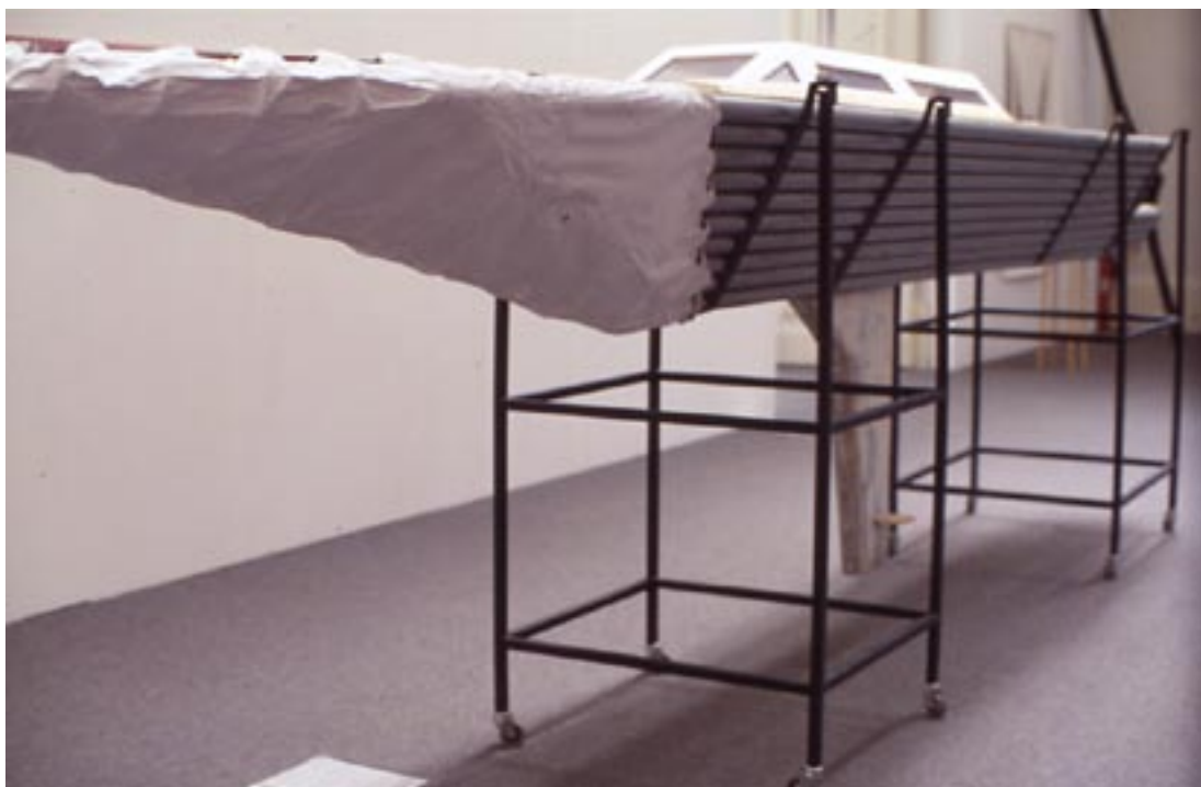
Hécatee/Bateau-Mémoire (maquette) ou création de matière à penser, 1988-1995

PVC, bois, plastique, nylon, acier, aluminium, 244 x 606 x 70 cm