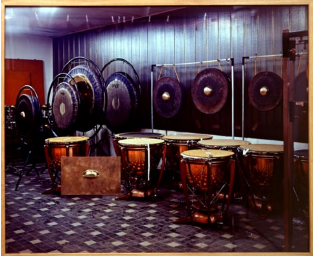
Sans titre , 1997 1,80 x 2 m