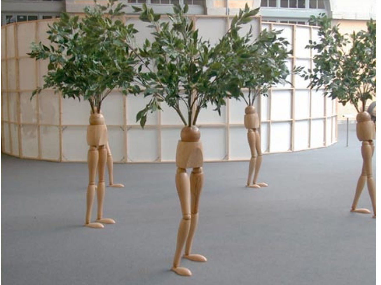
La forêt qui court (Dialogues) , 1994-1998

Bois, feuillage artificiel, 5 dialogues, 10 personnages 200 cm haut chaque élément